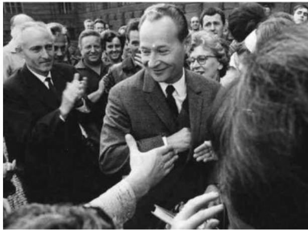
A. Dubcek, promotor en Checoslovaquia del “socialismo con rostro humano”

El 20 de agosto los tanques soviéticos aplicaron la “doctrina Breznev” e invadieron el país . La resistencia pasiva de los checos fue vencida, las libertades conseguidas se anularon y Dubcek y los reformistas fueron sustituidos por dirigentes fieles a Moscú.