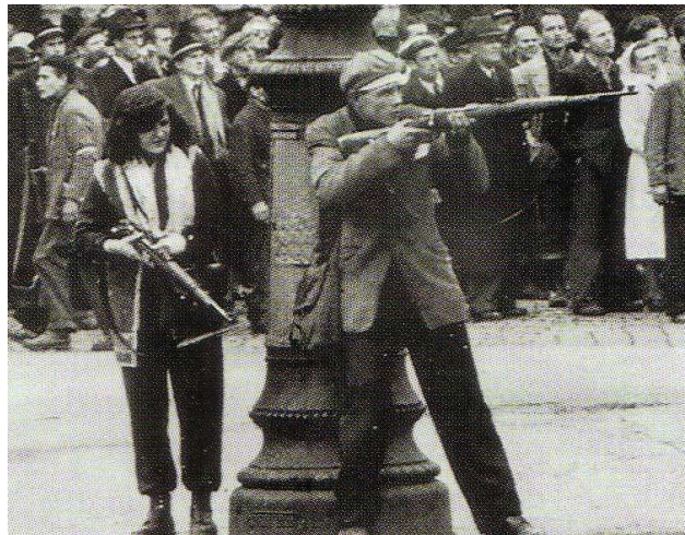
Manifestación en Budapest en 1956 contra el dominio soviético

En Hungría, en 1956 , el primer ministro Imre Nagy admitió en su gobierno a políticos no comunistas . Anunció el fin del régimen de partido único y el abandono del Pacto de Varsovia, con lo que el país se convertiría en un Estado neutral. Pero las tropas soviéticas entraron Budapest el 4 de noviembre , el movimiento húngaro fue derrotado y Nagy detenido y ejecutado en 1958 .