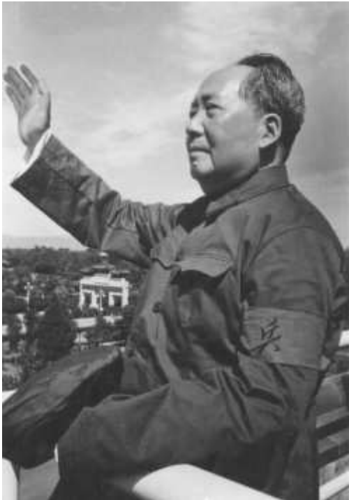
Mao Tse Tung (Mao Zedong), el Gran Timonel . 1893-1976.

El 1 de octubre de 1949, los comunistas proclamaron la República Popular China. Se iniciaba la construcción de una república socialista con la Unión Soviética como modelo y guía. En febrero de 1950 se firmó el pacto de amistad y ayuda mutua con Moscú por el cual técnicos y maquinaria soviéticos contribuirían al desarrollo del nuevo estado. El maoísmo se convirtió en el nuevo soporte ideológico. Se acometió la reforma agraria los grandes latifundistas fueron expropiados y la tierra se repartió entre los campesinos que formaron cooperativas agrarias según el modelo soviético. La industria y las infraestructuras se nacionalización. Las nuevas autoridades aplicaron