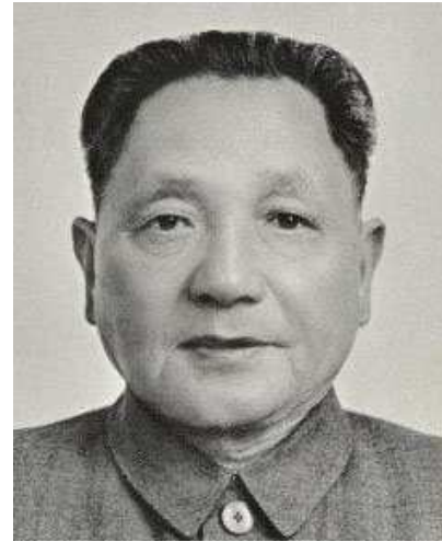
Deng Xiaoping (1904-1997).

A partir de 1969 la China revolucionaria se estabilizó. El país se abrió a Occidente al tiempo que se agravó el enfrentamiento con la Unión Soviética. En 1971 se produjo su ingreso en la ONU y ocupó un puesto permanente en el Consejo de Seguridad tras la expulsión de Taiwan. Los líderes perseguidos durante los tiempos convulsos de la revolución cultural fueron rehabilitados y Lin Biao murió al estrellarse el avión en el que huía hacia la Unión Soviética según la explicación oficial china tras fracasar su golpe de Estado contra Mao con el que pretendía revitalizar el radicalismo revolucionario.