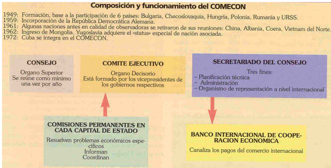
Organigrama sobre el funcionamiento del COMECON o CAME.

Rumanía formaron un bloque cohesionado sobre el que se había instaurado un férreo control soviético, a través de la ideología y de los partidos comunistas.