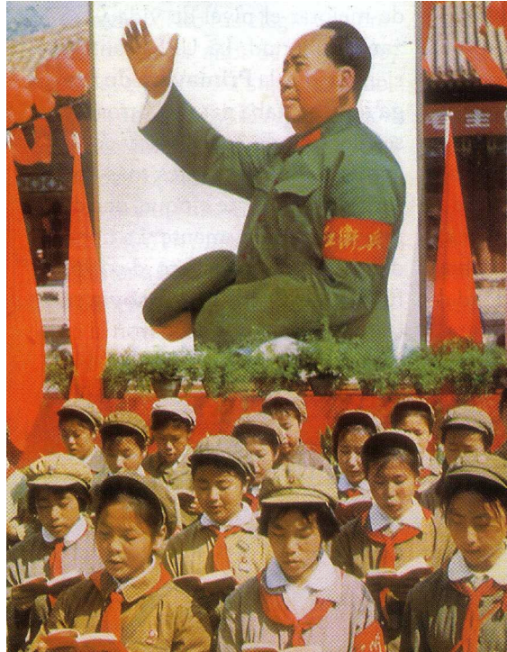
Jóvenes chinas haciendo lectura colectiva del Libro Rojo o antología de escritos de Mao.

El enfrentamiento con Moscú que comenzó en 1957 con el abandono de la tutela soviética sobre la económica se hizo definitivo en 1962 cuando Krushev fue acusado por China de traicionar la revolución mundial por su retirada en la crisis de los misiles. En 1964 la república Popular China explosionó su primera bomba atómica y se convirtió en una nueva potencia del socialismo, su éxito había completo.