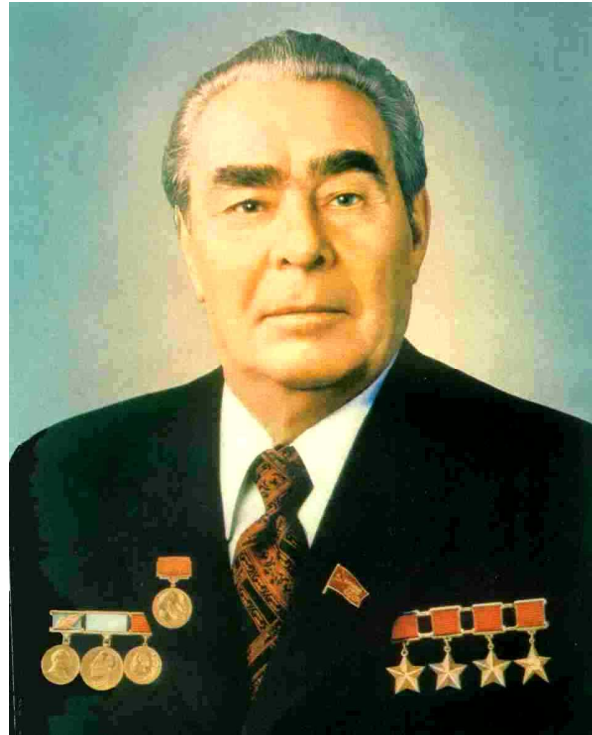
Leónidas Breznev (1906-1982).

Esta última circunstancia, unida a la lucha por el poder en el seno del partido, debilitó la posición del líder soviético que llegó a ser acusado en el Comité Central de errar en su previsión económica, de concentrar el poder y de practicar el amiguismo y el culto a la personalidad. Por ello fue relevado de sus cargos el 14 de octubre de 1964 .