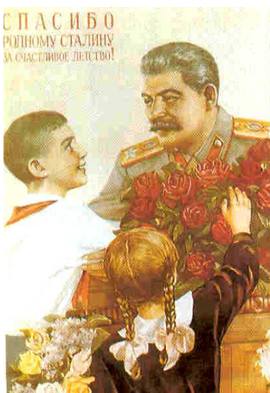
Cartel soviético donde se ensalza a Stalin como líder.