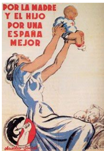
Cartel que reivindica el papel de las mujeres en la España nacional

A esto hay que sumar la pérdida de un tercio de las viviendas, carreteras, y la red ferroviaria que quedaron destruidas.