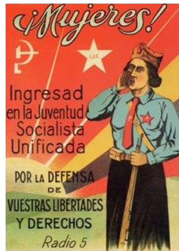
Cartel de la organización comunista J.S.U. incitando a la mujer republicana al ingreso

Por otro lado podemos resaltar el papel de la mujer .