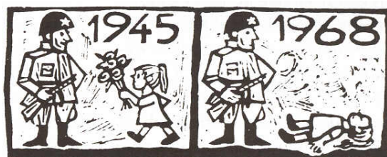
Dibujo satírico aparecido en Praga con motivo de la intervención soviética.

Dubcek acabaría sus días como guardia forestal en Eslovaquia.