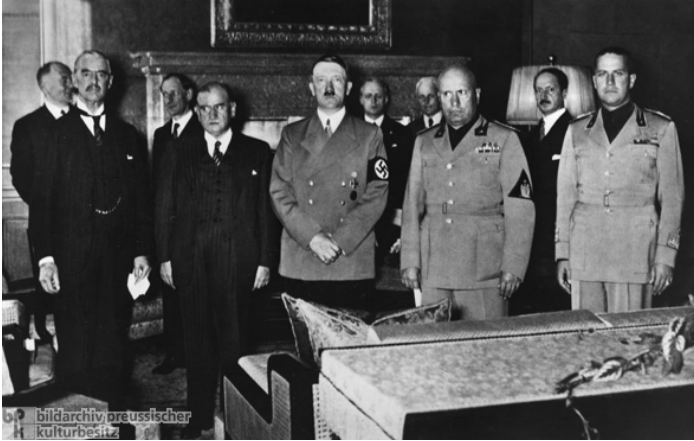
La Conferencia de Mucnich: 29-VIII-1938.

Austria tras su derrota en la I Guerra Mundial quedó reducida a un territorio muy pequeño de lengua y cultura alemana. Ya en los acuerdos de paz tras la I Guerra Mundial se habló de la posibilidad de que quedara unida a Alemania, esa posibilidad no se cumplió por el rechazo frontal de Francia e Italia.