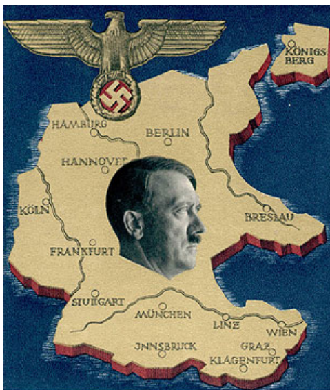
Cartel que conmemoraba el anschluss o anexión de Austria por parte de Alemania.

Fruto de lo anteriormente expuesto son una serie de pasos de Alemania, Italia y Japón que van a llevar hacia la guerra. La tensión en Europa era muy alta y Hitler se aprovechó de esa tensión y del deseo de paz de las democracias para avanzar un paso más en la expansión territorial de Alemania.