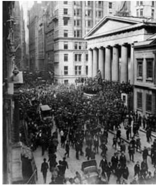
Wall Street el Jueves Negro.

Desde 1925 la economía norteamericana había ido creciendo de una manera importante, se supera la crisis de la postguerra y se inicia la etapa de la “ prosperity ” y de los locos años veinte en los que reina el optimismo. Uno de los mejores negocios era invertir en bolsa ; ésta fue creciendo de una manera espectacular debido a la especulación de los inversores sin tener correspondencia con la realidad económica, ese desajuste entre el estado real de la economía y el de la bolsa tenía que estallar por algún lado.