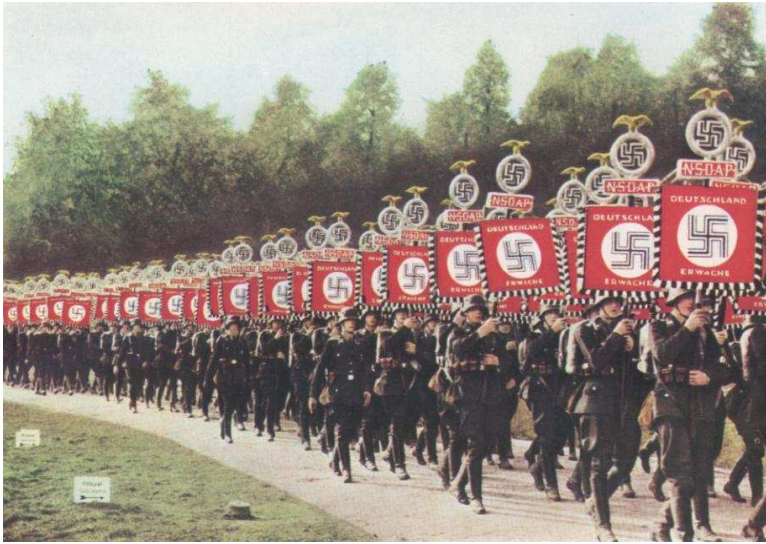
La Alemania nazi superó la crisis con un ambicioso programa armamentista.