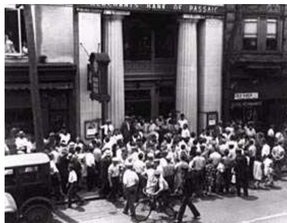
Ahorrradores intentando retirar su dinero de un banco.

La crisis de la bolsa será determinante. Desde septiembre de 1929 la tendencia alcista de la bolsa se estanca o inicia un descenso después de varios años de crecimiento ininterrumpido. En la última semana de octubre se produce la explosión, el desplome de la bolsa. Desde el 21 se acumulaban las órdenes de venta, viendo que la cosa iba mal muchos quieren vender sus acciones para recuperar su dinero; como había más órdenes de venta que compradores el precio de las acciones baja. Esta tendencia a la baja se ve frenada unos días por la compra de muchas