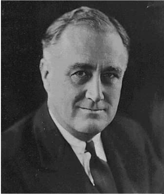
El presidente americano Franklin D. Roosevelt.