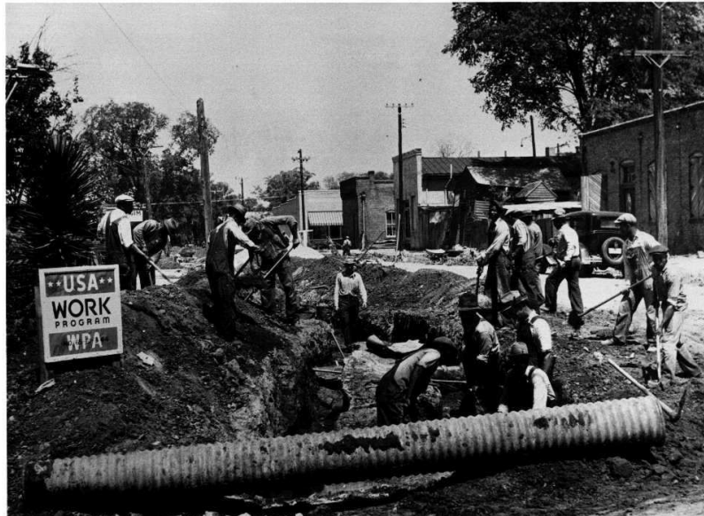
Programa de trabajo en el marco del New Deal.

Se pretendía relanzar la actividad industrial de las empresas privadas. El Estado promovió obras públicas. Destaca el Tennessee Valley Authority , que construyó grandes presas hidroeléctricas en esa zona.