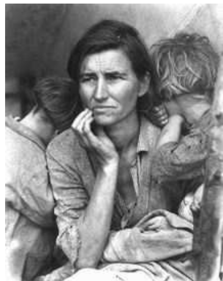
Las consecuencias en el campo fueron terribles.

Rápidamente los gobiernos se van a poner a trabajar para atajar los efectos de la crisis. En