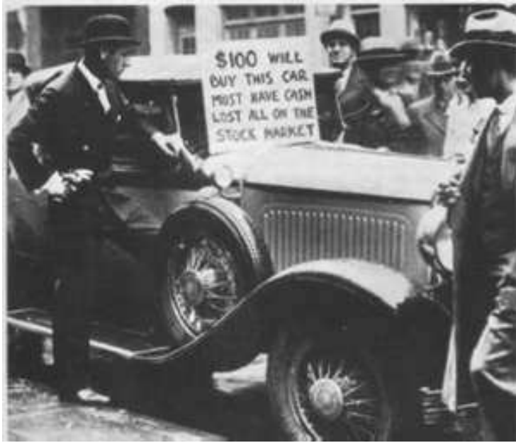
Ante la crisis un particular vende su coche en EE.UU.

acciones por la Banca Morgan. El 24 de octubre de 1929 , llamado el “ jueves negro ”, se produce un desplome espectacular de la bolsa, 13 millones de acciones salen al mercado y no encuentran comprador, ese desajuste entre la oferta y la demanda hace que el valor de las acciones caiga en picado. El 29 de octubre , el “ martes negro ”, son ya 16 millones, el pánico es tremendo, todo el mundo quiere vender para recuperar algo del capital. Empieza una crisis que durará varios años.