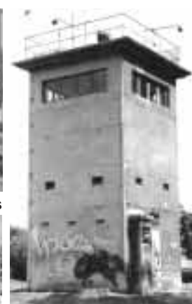
Torre de vigía