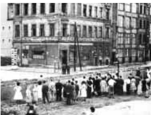
Los berlineses occidentales miran incrédulos y con asombro el cercado sector oriental