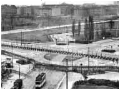
Arriba y abajo, imágenes de la Plaza Postdam