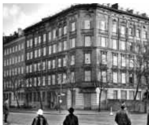
Los edificios en la calle Bernauer que quedaron en la línea divisoria fueron tapiados y desocupados para evitar fugas por ahí. Calles, vías del tren, estaciones del subterráneo e incluso cementerios fueron cerrados y destruidos para construir la muralla