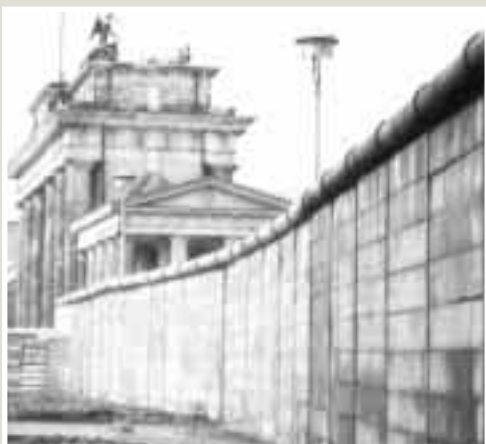
El muro de hormigón junto a la famosa Puerta de Bradenburgo

Al cumplirse 10 años de la histórica caída de uno de los más grandes monumentos a la intransigencia e intolerancia humanas, ofrecemos esta cronología gráfica sobre el Muro de Berlín: triste muestra de hasta dónde puede llegar la imposición forzada de un régimen político en la sociedad contemporánea