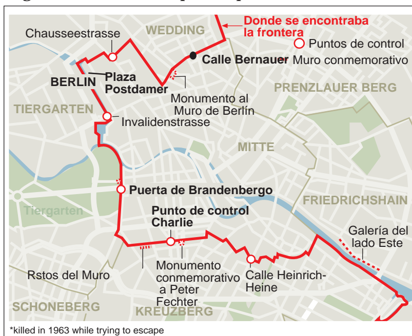
*killed in 1963 while trying to escape

El 13 de agosto de 1961, los líderes de la antigua República Democrática Alemana (RDA) ordenaron la construcción de una pared de concreto de 166 kilómetros de largo y cuatro metros de altura para dividir en dos la ciudad de Berlín. El objetivo oficial: "proteger a los habitantes de la RDA contra los ataques fascistas occidentales". Sin embargo, el objetivo real era otro: impedir el escape a la libertad de miles de ciudadanos inconformes con el régimen comunista impuesto por la Unión Soviética.