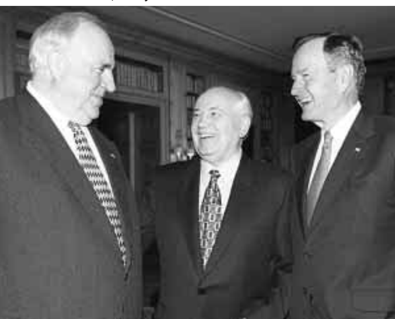
El ex canciller alemán Helmut Kohl, el ex líder soviético Mikhail Gorbachev y el ex presidente estadounidense George Bush, citados de izquierda a derecha, durante una plática en un periódico de Berlín el lunes 8 de este mes. Los tres ex líderes de la Guerra Fría se reunieron para conmemorar la caída del Muro de Berlín, ocurrida 10 años atrás

El 9 de noviembre de 1989, cerca de la 7:00 pm, el líder del partido comunista de Berlín Oriental, Gunter Schabowsky, anunció que la frontera con Berlín Occidental sería abierta para "viajes privados al exterior".