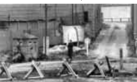
Obstáculos para tanques