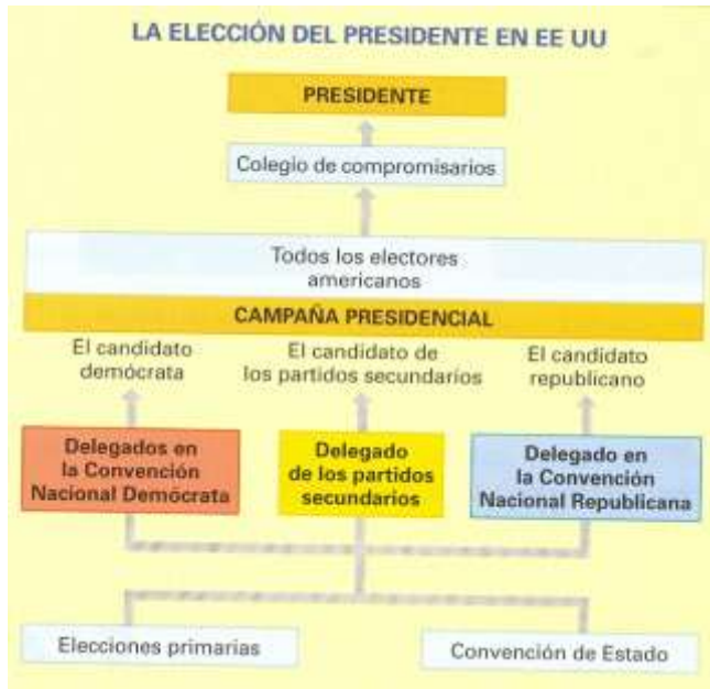
La elección del presidente en EE.UU.

Estado es el encargado de nombrar como presidente del Gobierno al líder del partido que ha obtenido la mayoría de los votos en las elecciones a la Asamblea de diputados. La preponderancia del parlamento otorga a los partidos políticos un papel de primer orden en la vida política del país. Ellos elaboran las candidaturas a las elecciones y organizan los grupos parlamentarios entre los diputados electos de cada partido.