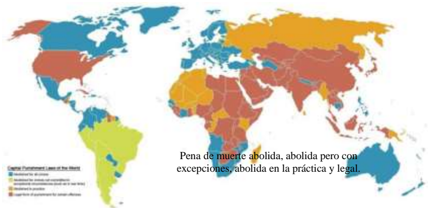
La pena de muerte en el mundo.

poder. En este contexto, la violencia es el medio más frecuente de relación entre el gobierno y sus opositores. Los movimientos armados se convierten en la única salida de una oposición que no dispone de recursos democráticos para expresarse ni de garantías democráticas para alcanzar el poder. En contraposición, el Estado legitima la violencia institucional como único medio para mantener orden social.