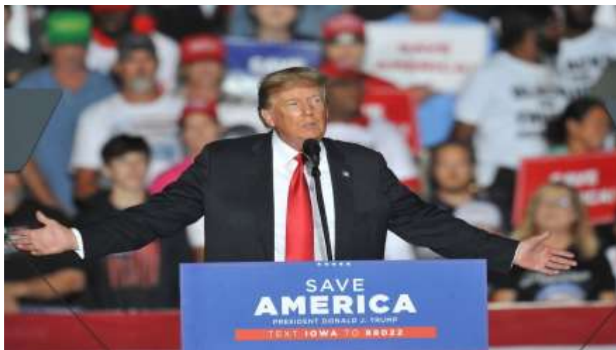
Mitin electoral de Donald Trump en las elecciones presidenciales de EEUU de 2016.

También ha perjudicado la salud de la democracia el protagonismo de los medios de comunicación , ya que son los que canalizan y construyen buena parte de la opinión pública. La guerra de estos medios por la audiencia ha convertido la legítima oposición política en un "espectáculo" de la política, que otorga un gran poder mediático a las grandes cadenas televisivas o radiofónicas y a la prensa. Un segundo orden de