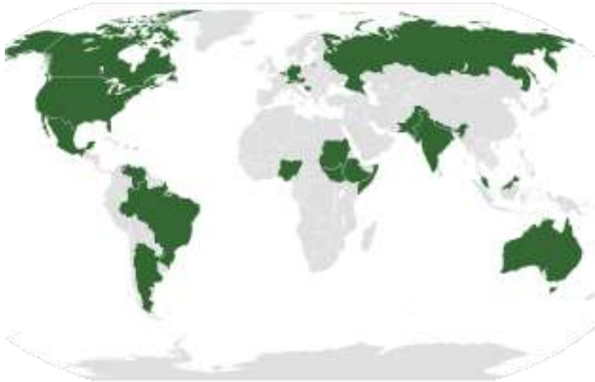
Países del mundo con estructura federal.

El modelo de Estado federal parte del reconocimiento de la personalidad de los diversos Estados que lo integran, y cada uno de ellos goza del derecho a legislar y a tener sus propias instituciones políticas. El poder y las responsabilidades políticas quedan, pues, repartidos entre los diversos Estados y el poder federal. Este último suele ocuparse de los asuntos referentes a política internacional, economía, defensa y seguridad. Es el