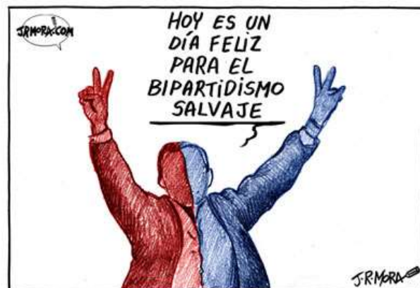
Aunque el pluripartidismo está teóricamente garantizado, se impone un bipartidismo real en muchos países.

La mayoría de los sistemas democráticos europeos (Francia, España e Italia) se basan en el multipartidismo. En el espectro de partidos democráticos predominantes, podemos distinguir tres grandes familias ideológicas: los conservadores, defensores de los derechos individuales y partidarios de mantener el orden social y de reducir la intervención del Estado; los demócratacristianos,