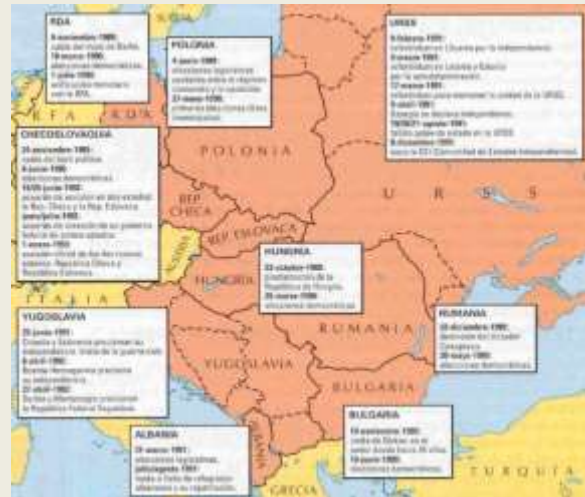
La caída del comunismo en la Europa central y del Este entre 1989 y 1990.