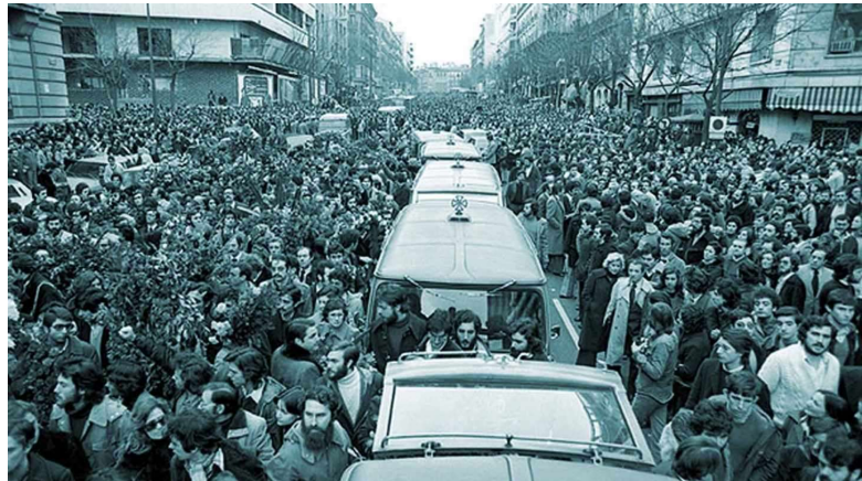
Entierro de los abogados muertos en el atentado de Atocha, el momento más difícil de la Transición.

Dentro de los grupos inmovilistas vemos a instituciones, corrientes políticas y personas destacadas del franquismo, desde una gran parte del Ejército a movimientos variados (Fuerza Nueva, Falange...) que podemos calificar como de extrema derecha que perciben, con razón, que el camino a la democracia significa el desmantelamiento del franquismo