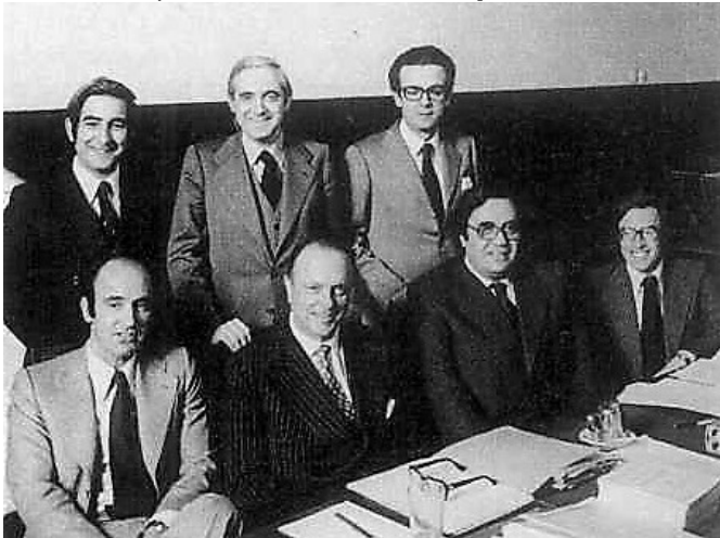
Los padres de la Constitución (de arriba abajo y de izquierda a derecha): José Pedro Pérez Llorca, Gabriel Cisneros, Miguel Herrero, Miquel Roca, Manuel Fraga, Gregorio Peces Barba y Jordi Solé Tura.

Mientras tanto, el país era sacudido por el terrorismo , con durísimos ataques por organizaciones extremistas de derecha y de izquierda. A pesar de la amnistía (Ley de 15 de octubre de 1977), que daba libertad a los presos de ETA ésta continúa atentando. Sus objetivos eran los militares a los que se les quería provocar para que bloquearan el proceso hacia la democracia: en 1978 ETA mató a 65 personas y, entre 1975 y 1980, a 236.