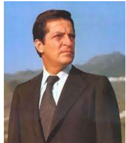
Adolfo Suárez González (1976-1981).

Conforme avanzaban los días, en vez de tener problemas con la oposición democrática, para el gobierno los obstáculos a la reforma le surgían de los sectores inmovilistas y del propio Ejército, la disconformidad del vicepresidente del gobierno para Asuntos de la Defensa, teniente general Fernando de Santiago , conllevó su sustitución por el teniente general Gutiérrez Mellado , que será otro de los puntales del proceso de reforma, en este caso, para la reforma militar.