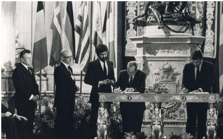
El presidente del gobierno español Felipe González firma el Acta de adhesión de España a la CEE, 12-06-1985

Pedro Sánchez ha ganado la moción de censura, pero está en franca minoría y en febrero de 2019, al no ver aprobados los presupuestos, disuelve las Cortes y se convocan elecciones que tendrán que repetirse al no lograr mayoría para gobernar (esos problemas ya los tuvo Rajoy en