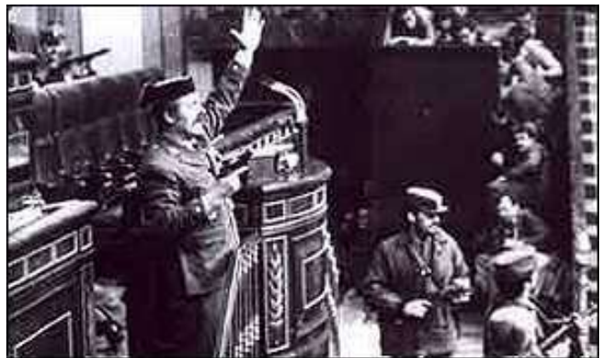
El fracasado intento de golpe de Estado del 23-F de 1981.

En el Ejército había sectores contrarios al proceso democrático y los ánimos estaban muy caldeados ante la escalada terrorista de ETA, la aprobación de los estatutos de autonomía y la reforma de Ejército. Había, en definitiva, militares dispuestos a protagonizar un golpe de Estado. El momento elegido no pudo ser mejor: poco después de las seis de la tarde del 23 de febrero de 1981, mientras se estaba realizando en el Congreso de los Diputados la votación de investidura de Leopoldo Calvo Sotelo como sucesor de Suárez en la