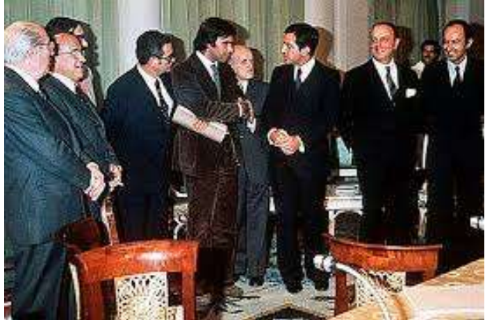
Firma de los Pactos de La Moncloa en 1977, punto de partida para el estado de bienestar en la democracia.

ve en las huelgas obreras (especialmente en la minería asturiana, en la siderurgia vasca y en las zonas industriales de Madrid y Barcelona). En ese momento –finales del franquismo- se va a fortalecer el sindicato UGT y se desarrollará más Comisiones Obreras. No sólo luchan por mejoras laborales, luchan para acabar con la dictadura, para pedir la democracia y se hace en la calle y en los puestos de trabajo, con manifestaciones y movilizaciones masivas. Serán el objetivo de aquellos grupos que no quieren abandonar el franquismo -grupos paramilitares de ultraderecha- como se vio en el asesinato de los abogados laboristas de Atocha en enero de 1977. Pero no son solo los movimientos obreros los que se echan a la calle a favor de la democracia, surgen por todos lados otros movimientos que recogen las ansias de libertad y piden también la democracia: movimientos estudiantiles, vecinales y culturales, colegios profesionales, círculos intelectuales... la demanda es siempre la misma: libertad de expresión, mejoras sociales, democracia... De la misma manera en Cataluña y en el País Vasco, además de la lucha por la democracia, se produce la movilización ciudadana también a favor de la autonomía y el reconocimiento de sus identidades diferenciadas. También dentro de la Iglesia , uno de los pilares del régimen franquista, se produce un movimiento que en los últimos años del franquismo ya había marcado distancias con el régimen y que ahora anima a seguir en el camino hacia la democracia.