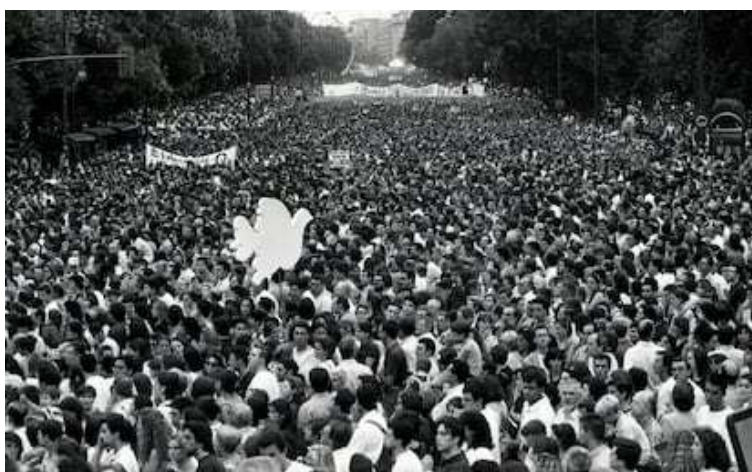
Manifestación en Madrid contra ETA tras el asesinato de Miguel Ángel Blanco. En julio de 1997.

En cuanto al terrorismo, ETA sigue matando, sigue siendo un problema. En 1997 el asesinato anunciado de Miguel Ángel Blanco, un concejal del PP en Ermua (Vizcaya), secuestrado por ETA, hace que aumente la repulsa a nivel nacional contra la banda armada en un movimiento cívico conocido como Espíritu de Ermua , pero, las diferencias entre el PP y el PNV son crecientes y se inicia una deriva independentista con la firma del Pacto de Lizarra entre el PNV, Herri Batasuna y otras fuerzas a favor de la autodeterminación (el que los vascos y navarros voten si quieren o no la independencia), lo que origina grandes tensiones. La firma del Pacto Antiterrorista con el PSOE en 2001 lleva a la ilegalización de Herri Batasuna (el brazo político de ETA) y a un mayor aislamiento y debilidad de la banda.