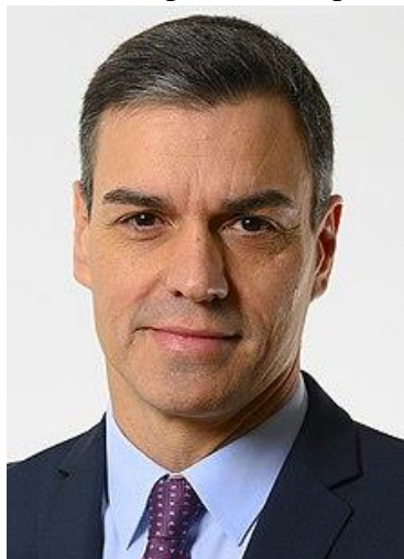
Pedro Sánchez (2018-...).

El gobierno del PP y de Mariano Rajoy acabó de manera abrupta cuando Pedro Sánchez , líder del PSOE, ganó una moción de censura el 1 de junio de 2018. Rajoy abandonó la política y fue sustituido como líder del PP por Pablo Casado. El día 2 de junio Pedro Sánchez era nombrado presidente, pero con insuficientes apoyos parlamentarios. Al no ver aprobados los presupuestos generales del Estado, el día 15 de febrero de 2019 convoca elecciones para el 28 de abril . En esa consulta el partido vencedor es el PSOE, pero con mayoría simple, al no alcanzar un acuerdo con Unidas Podemos ni conseguir que PP o Ciudadanos se abstuvieran en la moción de investidura, se disuelven las Cortes y se convocan nuevas elecciones para el 10 de noviembre . De nuevo el vencedor es el PSOE pero con tres escaños menos, Ciudadanos se hunde y Vox irrumpe con fuerza en el Parlamento. Esta vez sí se consigue un acuerdo con Unidas Podemos y el día 8 de enero de 2020 se pone en marcha el primer gobierno de coalición de la democracia. Desde finales de febrero y procedente de China se extiende por el mundo una pandemia conocida como COVID-19, que obliga a la práctica paralización de la vida económica y genera una elevada mortandad que se ceba en España y en especial en la población de más edad.