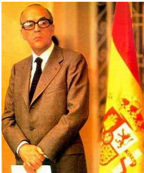
Leopoldo Calvo Sotelo (1981-1982).

Dos días después del golpe, Calvo Sotelo era nombrado presidente de un gobierno que duraría año y medio y que estaría presidido por las disensiones internas en el seno de la UCD; sin embargo, el intento de golpe de Estado contribuyó a rebajar la tensión política.