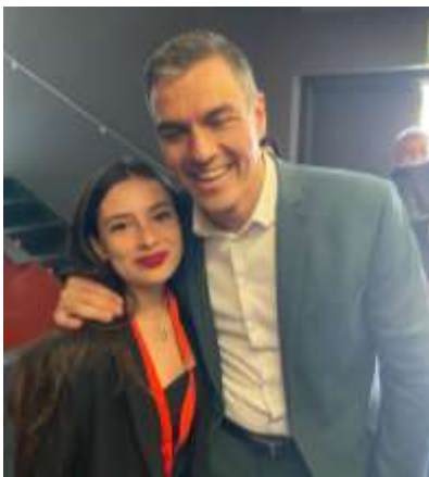
Pedro Sánchez (2018-...).

El gobierno del PP y de Mariano Rajoy acabó de manera abrupta cuando Pedro Sánchez , líder del PSOE, ganó una moción de censura el 1 de junio de 2018. Rajoy abandonó la política y fue sustituido como líder del PP por Pablo Casado. El día 2 de junio Pedro Sánchez era nombrado presidente, pero con insuficientes apoyos parlamentarios. Al no ver aprobados los presupuestos generales del Estado, el día 15 de febrero de 2019 convoca elecciones para el 28 de abril . En esa consulta el partido vencedor es el PSOE, pero con mayoría simple, al no alcanzar