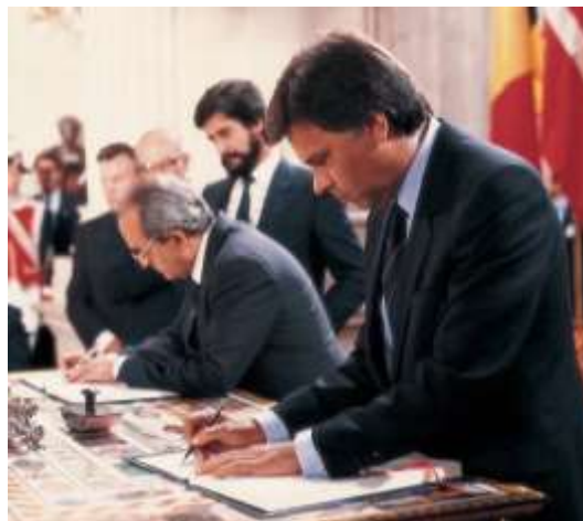
Felipe González Márquez firma el acta de adhesión de España a la Comunidad

Las elecciones del 28 de octubre de 1982 dieron el triunfo al PSOE, con el mensaje electoral del “cambio” y a su líder Felipe González Márquez , con más de diez millones de votos favorables y la mayoría absoluta en las Cortes. El primer problema que tuvo que tratar el nuevo gobierno, y que no había sido abordado durante toda la transición, era el de la grave situación económica que necesitaba medidas urgentes y duras. Entre estas: la devaluación de la peseta, subida de los tipos de interés, aumento de los impuestos... La medida más espectacular fue el proceso de reconversión industrial que llevó al cierre de muchas empresas siderometalúrgicas que no eran rentables.