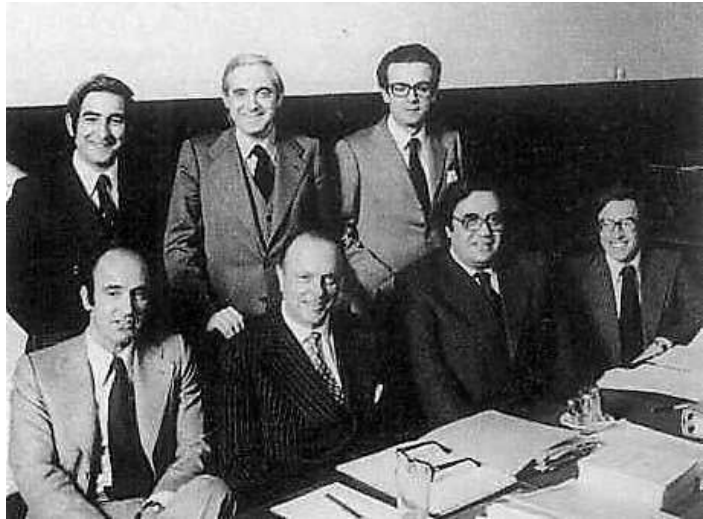
Los padres de la Constitución (de arriba abajo y de izquierda a derecha): José Pedro Pérez Llorca, Gabriel Cisneros, Miguel Herrero, Miquel Roca, Manuel Fraga, Gregorio Peces Barba y Jordi Solé Tura.

La Constitución de 1978 (con 169 artículos) recoge en su Título Preliminar un conjunto de principios y valores que vienen a definir a España como un “ Estado social y democrático de derecho ”, en consecuencia, se fija el sometimiento de todos los poderes del Estado a la legalidad, a lo que marque la Ley, el Derecho. Establece que la “ soberanía nacional reside en el pueblo español, del que emanan los poderes del Estado”; indica que la forma política del Estado español “es la monarquía parlamentaria ”; por último, hace saber que el Estado se fundamenta en la “ indisoluble unidad de la nación española ” pero reconoce y garantiza el derecho a la autonomía de “nacionalidades” y regiones .