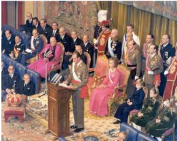
Acto de coronación de D. Juan Carlos. (22-XI-1975).

A la muerte de Franco, el rey mantuvo al frente del gobierno a Arias Navarro , un convencido franquista al que no se le podía pedir, como se vio desde muy pronto, que liderara la transición hacia un sistema político democrático. No obstante, Arias Navarro incorporó a su gobierno políticos de corte aperturista (Manuel Fraga, José M a de Areilza y Antonio Garrigues) e inició algunos cambios: concedió un indulto, permitió la actuación, de hecho, de los partidos políticos.