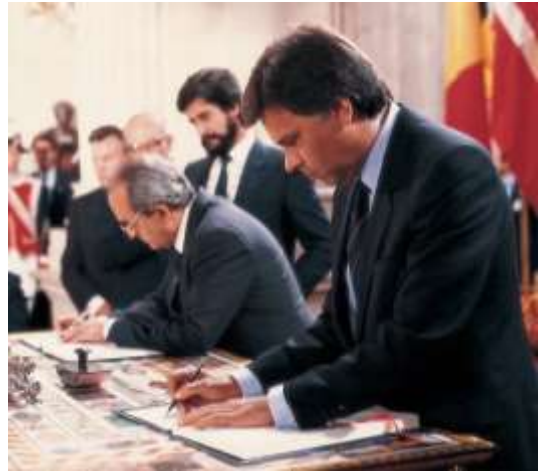
Felipe González Márquez firma el acta de adhesión de España a la Comunidad Económica Europea

Las elecciones del 28 de octubre de 1982 dieron el triunfo al PSOE, con el mensaje electoral del “cambio” y a su líder Felipe González Márquez , con más de diez millones de votos favorables y la mayoría absoluta en las Cortes. El primer problema que tuvo que tratar el nuevo gobierno, y que no había sido abordado durante toda la transición, era el de la grave situación económica que necesitaba medidas urgentes y duras. Entre estas: la devaluación de la peseta, subida de los tipos de interés, aumento de los impuestos... La medida más espectacular fue el proceso de reconversión industrial que llevó al cierre de muchas empresas siderometalúrgicas que no eran rentables.