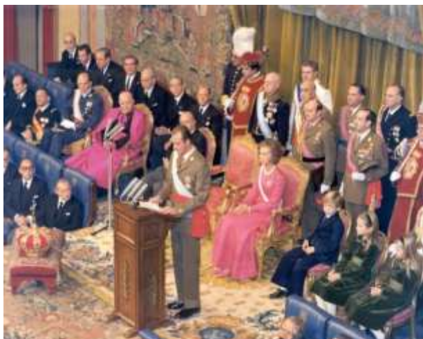
Acto de coronación de D. Juan Carlos. (22-XI-1975).

A la muerte de Franco, el rey mantuvo al frente del gobierno a Arias Navarro , un convencido franquista al que no se le podía pedir, como se vio desde muy pronto, que liderara la transición hacia un sistema político democrático. No obstante, Arias Navarro incorporó a su gobierno políticos de corte aperturista (Manuel Fraga, José M a de Areilza y Antonio Garrigues) e inició algunos cambios: concedió un indulto, permitió la actuación, de hecho, de los partidos políticos.