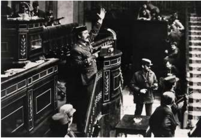
Tejero dirigiéndose a los diputados (23-II-81)