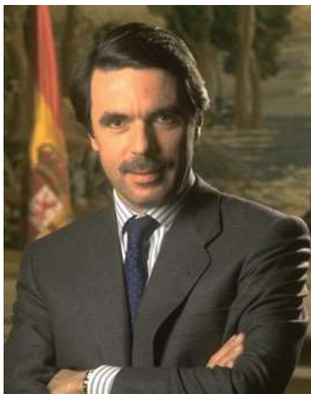
José María Aznar López (1996-2004).

empezaron a aparecer los primeros casos de corrupción que afectarían al partido en el gobierno.