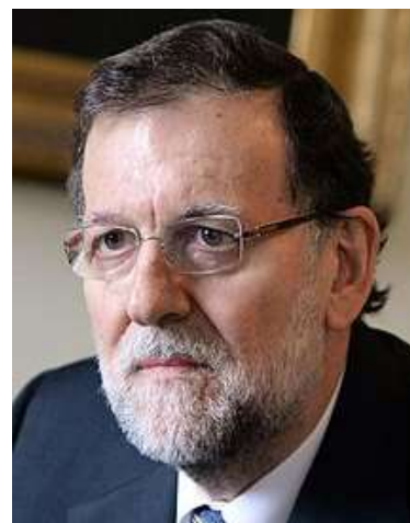
Mariano Rajoy (2011-2018).

Pero sin duda el problema más fuerte al que se tuvo que enfrentar el ejecutivo fue la deriva independentista en Cataluña . Con la mayoría del Parlament se aprobó una Ley de Referéndum que fue declarada inconstitucional por el Tribunal Constitucional y basándose en esa ley se convocó un plebiscito ilegal el día 1 de octubre de 2017 a pesar de las advertencias del gobierno central. La jornada transcurrió llena de incidentes y con la actuación de las fuerzas de seguridad del Estado. La reiteración en su actitud del president Carles Puigdemont motivó la suspensión provisional de la autonomía de Cataluña mediante el artículo 155 de la Constitución. Al día siguiente se producen los primeros casos de detención de políticos catalanes responsables y la huida de Puigdemont a Bruselas. Convocadas elecciones a la Generalitat el 21 de diciembre de 2017, fueron vencidas por Ciudadanos, pero las fuerzas proindependentistas unidas tendrían la mayoría. Entraba así el problema en una situación de difícil salida: políticos presos, reiteración en la inconstitucionalidad de algunas leyes anteriores... En este contexto el 14 de mayo de 2018 fue nombrado presidente el soberanista Quim Torra.