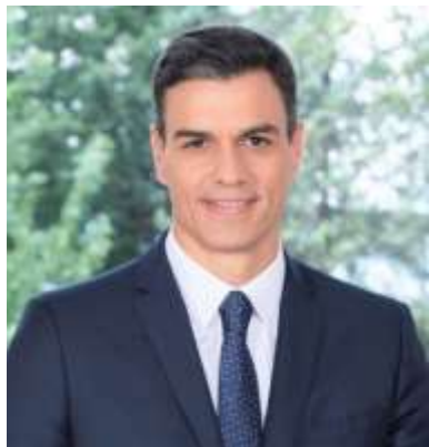
Pedro Sánchez (2018-...).