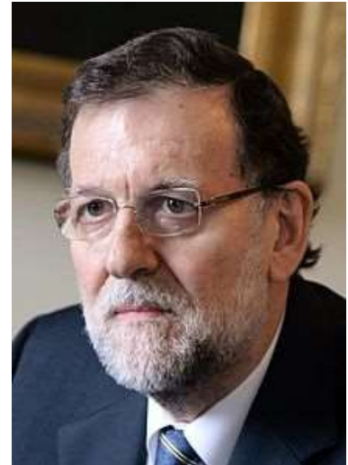
Mariano Rajoy (2011-2018).

El 20 de diciembre de 2015 se desarrollan unas elecciones generales ganadas por el Partido Popular pero sin mayoría suficiente para gobernar. Las negociaciones con otras fuerzas durarán meses, y al final acabará en fracaso y serán necesarias nuevas elecciones para el 26 de junio de 2016 , los resultados de estas confirman los anteriores datos; el entendimiento sigue siendo difícil. Por fin el 31 de octubre de 2016 , con el apoyo de varios grupos, Mariano Rajoy juró su cargo como presidente del Gobierno. La legislatura se caracterizó por la aparición de numerosos casos de corrupción.