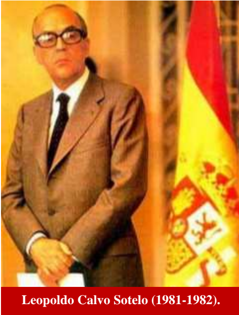
Leopoldo Calvo Sotelo (1981-1982).

Dos días después del golpe, Calvo Sotelo era nombrado presidente de un gobierno que duraría año y medio y que estaría presidido por las disensiones internas en el seno de la UCD; sin embargo, el intento de golpe de Estado contribuyó a rebajar la tensión política.