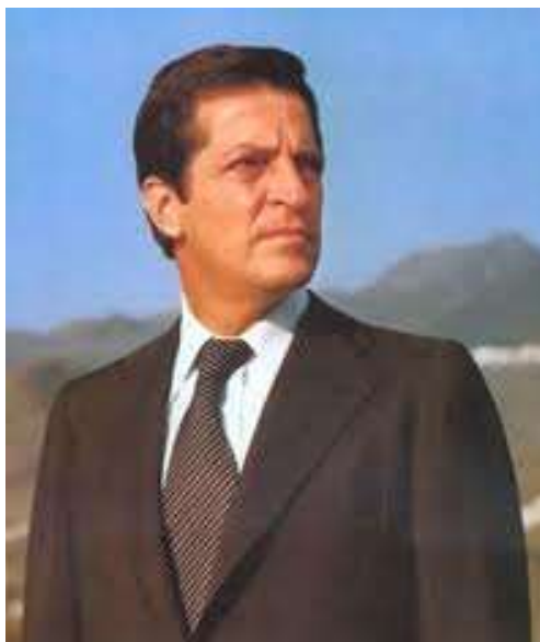
Adolfo Suárez González (1976-1981).

El gobierno de Suárez seguía en su empeño de acabar con el franquismo desde el franquismo . La tarea no era tan fácil y hubo momentos en que el objetivo de instaurar la democracia podía verse frenado. Veremos a continuación los pasos más importantes hasta la celebración de las elecciones generales el 15 de junio de 1977: