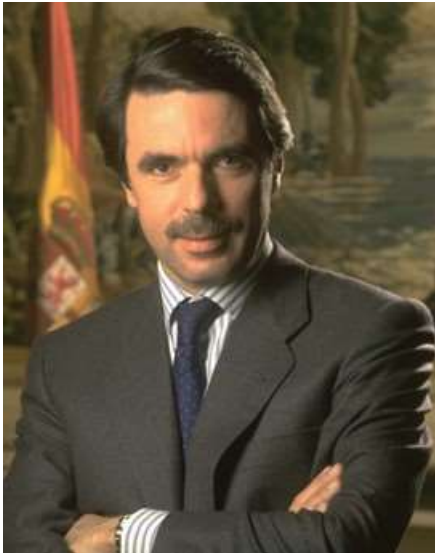
José María Aznar López (1996-2004).

empezaron a aparecer los primeros casos de corrupción que afectarían al partido en el gobierno.