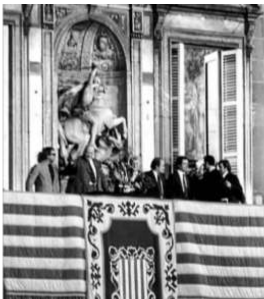
J. Tarradellas (1899-1988) saluda desde el balcón del palau de la Generalitat el 23 de octubre de 1977.

los sucesivos gobiernos habían aparcado la toma de decisiones en este sentido y ahora la situación era insostenible: una inflación situada en el 24,7% en 1977, aumento del paro, déficit exterior galopante... El gobierno de Suárez propuso un pacto a todas las fuerzas políticas y sindicales para combatir la crisis, basado en la contención de los salarios, la devaluación de la peseta, una política monetaria restrictiva para reducir la masa monetaria en circulación, proceder a una reforma fiscal... Estos acuerdos, conocidos como los Pactos de la Moncloa , fueron aprobados por todas las formaciones el día 27 de octubre de 1977. Como se comprueba, el consenso fue la tónica dominante, todas las formaciones se comprometieron a luchar contra la crisis, incluyendo a la patronal y a los sindicatos. Esta política de consenso culminaría en la elaboración de la Constitución.