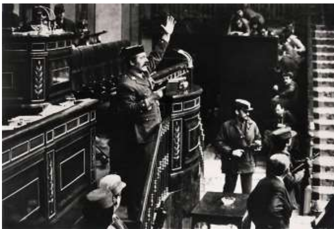
Tejero dirigiéndose a los diputados (23-II-81)