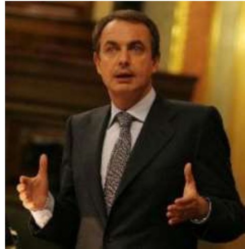
José Luis Rodríguez Zapatero (2004- 2011).

Las elecciones de 2008 revalidan el triunfo de Zapatero . Si la legislatura anterior había sido de crecimiento y un deterioro de la economía al final, en esta, la crisis –negada machaconamente por el Gobierno al principio de su andadura- estará omnipresente . El ejecutivo de Zapatero pone en marcha un amplio abanico de medidas para enderezar la economía que genera un profundo malestar: reforma laboral, recortes sociales de todo tipo (12 de mayo de 2010)... pero nada puede evitar el colapso económico del sector financiero y el de la construcción, pilares en los que se asentaba el crecimiento de la etapa anterior. El paro alcanza la cifra récord de casi 5 millones de personas. En este clima el PP gana las elecciones autonómicas, de manera aplastante, en gran parte de las comunidades en mayo de 2011, es sólo un anticipo de lo que pasará el día 20 de noviembre, en esa fecha se desarrollan elecciones generales anticipadas que dan la mayoría absoluta al Partido Popular liderado por Mariano Rajoy .