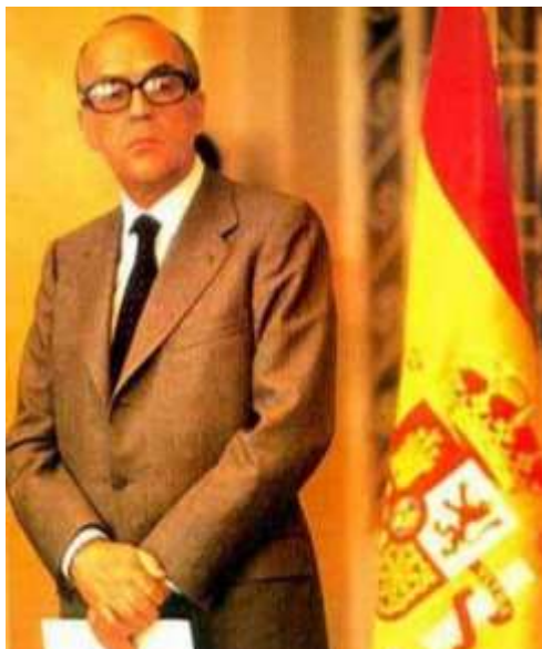
Leopoldo Calvo Sotelo (1981-1982).

Dos días después del golpe, Calvo Sotelo era nombrado presidente de un gobierno que duraría año y medio y que estaría presidido por las disensiones internas en el seno de la UCD; sin embargo, el intento de golpe de Estado contribuyó a rebajar la tensión política.