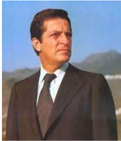
Adolfo Suárez González (1976-1981).