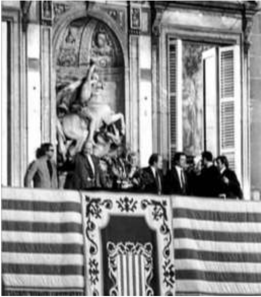
J. Tarradellas (1899-1988) saluda desde el balcón del palau de la Generalitat el 23 de octubre de 1977.

los sucesivos gobiernos habían aparcado la toma de decisiones en este sentido y ahora la situación era insostenible: una inflación situada en el 24,7% en 1977, aumento del paro, déficit exterior galopante... El gobierno de Suárez propuso un pacto a todas las fuerzas políticas y sindicales para combatir la crisis, basado en la contención de los salarios, la devaluación de la peseta, una política monetaria restrictiva para reducir la masa monetaria en circulación, proceder a una reforma fiscal... Estos acuerdos, conocidos como los Pactos de la Moncloa , fueron aprobados por todas las formaciones el día 27 de octubre de 1977. Como se comprueba, el consenso fue la tónica dominante, todas las formaciones se comprometieron a luchar contra la crisis, incluyendo a la patronal y a los sindicatos. Esta política de consenso culminaría en la elaboración de la Constitución.