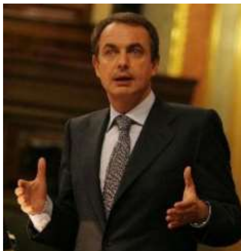
José Luis Rodríguez Zapatero (2004- 2011).

Las elecciones de 2008 revalidan el triunfo de Zapatero . Si la legislatura anterior había sido de crecimiento y un deterioro de la economía al final, en esta, la crisis –negada machaconamente por el Gobierno al principio de su andadura- estará omnipresente . El ejecutivo de Zapatero pone en marcha un amplio abanico de medidas para enderezar la economía que genera un profundo malestar: reforma laboral, recortes sociales de todo tipo (12 de mayo de 2010)... pero nada puede evitar el colapso económico del sector financiero y el de la construcción, pilares en los que se asentaba el crecimiento de la etapa anterior. El paro alcanza la cifra récord de casi 5 millones de personas. En este clima el PP gana las elecciones autonómicas, de manera aplastante, en gran parte de las comunidades en mayo de 2011, es sólo un anticipo de lo que pasará el día 20 de noviembre, en esa fecha se desarrollan elecciones generales anticipadas que dan la mayoría absoluta al Partido Popular liderado por Mariano Rajoy .