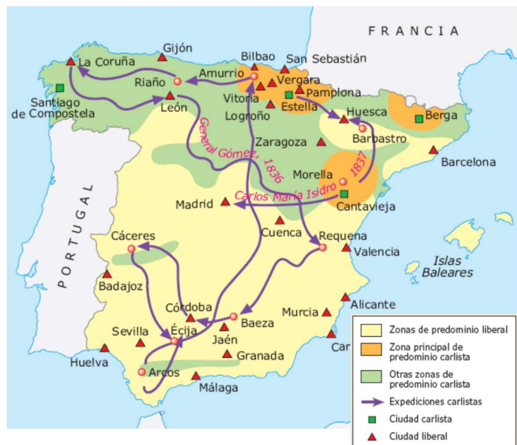
El desarrollo de la primera guerra carlista.