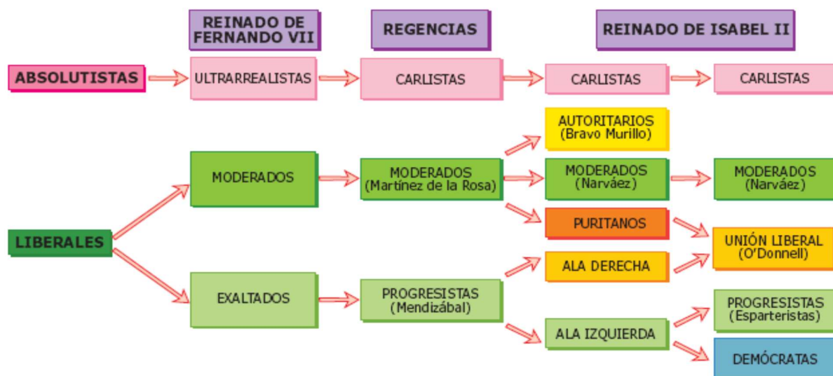
Evolución de las distintas tendencias políticas durante los reinados de Fernando VII e Isabel II.

guerra carlista, la monarquía implantó el régimen liberal. Ahora bien, con el establecimiento del Estado liberal surgieron las diferencias entre los mismos liberales, como ya empezó a comprobarse en las Cortes del Trienio Liberal. Por una parte, estaban los moderados y, por otra, los progresistas. Ambos defendían el sistema político liberal, pero presentaban profundas diferencias ideológicas.