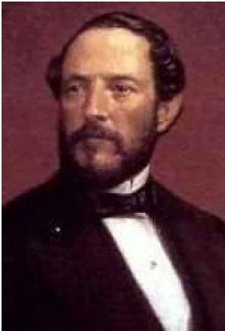
Juan Prim (1814-1870).

de los ataques marroquíes. En varias batallas se impuso el ejército español bajo la dirección de los generales O'Donnell y Prim. Se logró la ampliación de la plaza de Ceuta, pero se esperaban mayores ventajas territoriales en proporción al esfuerzo realizado. También se intervino, por otras razones, en México, con un ejército al mando del general Prim.