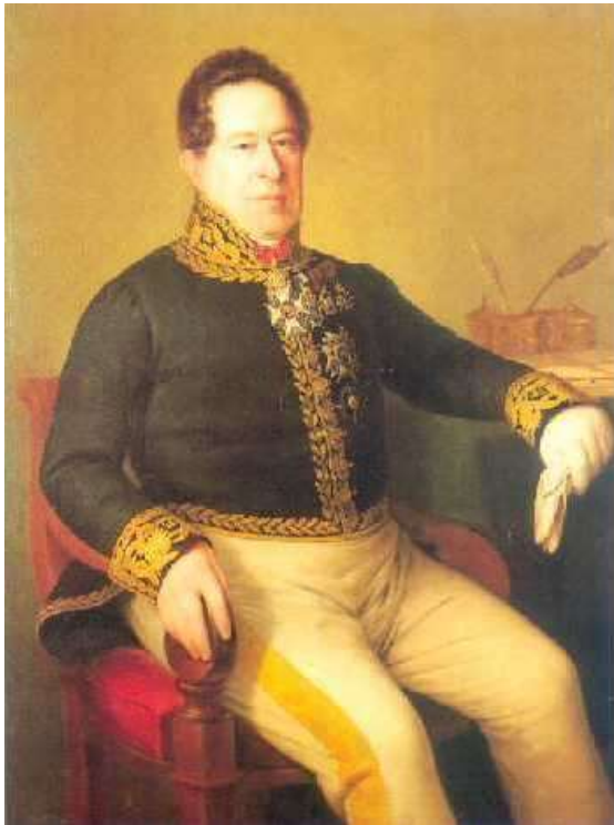
Juan Álvarez de Mendizábal (1790-1853).

mayo de 1836 Mendizábal decidió dimitir ante las diferencias con la regente a la hora del nombramiento de determinados cargos militares. Era lo que buscaba la regente, que encargó a Francisco Javier Istúriz (mayo-agosto de 1836) formar gobierno. Pero éste, de corte moderado, no contaba con el apoyo de las Cortes (Estamento de Procuradores). Otra vez volvían, en julio y agosto, los levantamientos populares de signo progresista contra el gobierno y a favor del restablecimiento de la Constitución de 1812. Por fin, el 12 de agosto (1836) tenía lugar el motín de los sargentos de La Granja , que obligó a la regente a restablecer la Constitución de 1812 y a formar un nuevo gobierno con José María Calatrava al frente (agosto de 1836-agosto de 1837) y Mendizábal en Hacienda. Es a partir de ahora cuando quedó consolidada la división de los liberales entre un partido moderado y otro progresista, que era el que subía al poder con Calatrava.