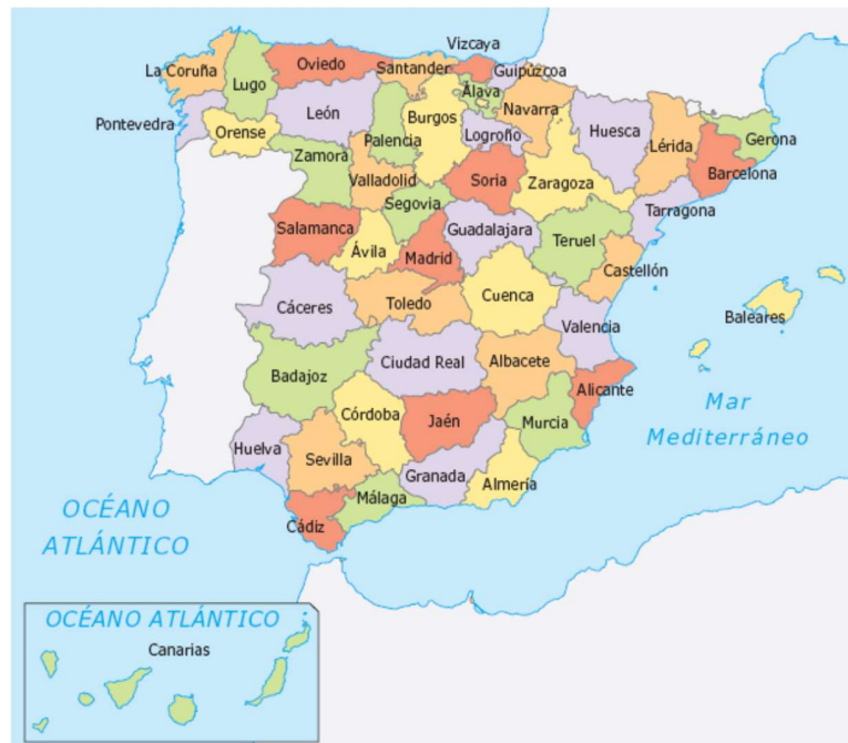
División provincial de Javier de Burgos de 1833, consolidada con el gobierno moderado, con pocas diferencias está todavía vigente.

A todo esto, como es imaginable, la regente no se encontraba a gusto con Mendizábal. En