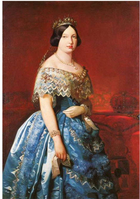
Isabel II (1830-1904).

La división interna entre los mismos moderados contribuyó a que cayera el gobierno de Bravo Murillo y ello abrió un nuevo periodo de inestabilidad política, con fuerte desgaste de los moderados. El gobierno terminó siendo acusado de escándalos administrativos en la construcción del ferrocarril, facilitando negocios sucios y enriquecimientos escandalosos. Cuando el Senado decidió votar en contra de las concesiones ferroviarias propuestas por el gobierno éste decidió perseguir a cuantos habían votado en contra suya. El mecanismo destinado a facilitar el acceso al poder de los progresistas se puso en marcha. En efecto, un grupo de militares tomó la iniciativa y decidió pronunciarse contra el gobierno. Comenzaba la " Vicalvarada ".