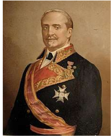
Leopoldo O'Donnell (1809-1867).

La crisis que acaba con el gobierno de Espartero, y con ella también con el Bienio, es una consecuencia del clima de conflictividad social. En Barcelona, los trabajadores venían reivindicando mejoras sociales en un clima de tensión social, pero fue en tierras de Castilla (Palencia y Valladolid) donde la carestía del pan provocó motines de subsistencias , cuya represión provocó fuertes diferencias en el seno del mismo gobierno. Tras presentar su dimisión el ministro de la Gobernación, Espartero decidió hacer otro tanto. Era lo que venía deseando la reina, al igual que los moderados. La reina, entonces, llamó a O'Donnell para formar gobierno (14 de julio (1856). Mientras tanto, los diputados progresistas y demócratas de las Cortes, que negaban su confianza al nuevo gobierno, no tuvieron más remedio que abandonar la cámara cuando las tropas gubernamentales iniciaban el cañoneo del edificio y los primeros cascos de granada entraban en la sala de sesiones...