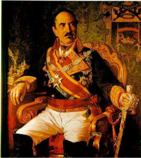
Baldomero Espartero (1793-1879).

fusilamiento de los generales implicados en el golpe.