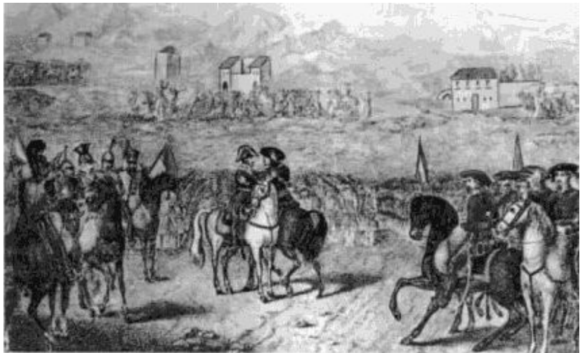
Abrazo de Vergara entre Espartero y Maroto en 1839 que ponía fin a la primera guerra carlista.

el norte. Al año siguiente, en 1837, tuvo lugar la "expedición real", que partió de Navarra en mayo, bajo la dirección del propio pretendiente y a la que se unió Ramón Cabrera, llegando a las afueras del Madrid en septiembre; sin embargo, la acción del general Espartero obligó al pretendiente a regresar al País Vasco. Los fracasos militares carlistas empezaban a escindir a los dirigentes carlistas conscientes de la imposibilidad de una victoria militar. La tercera fase tuvo lugar entre