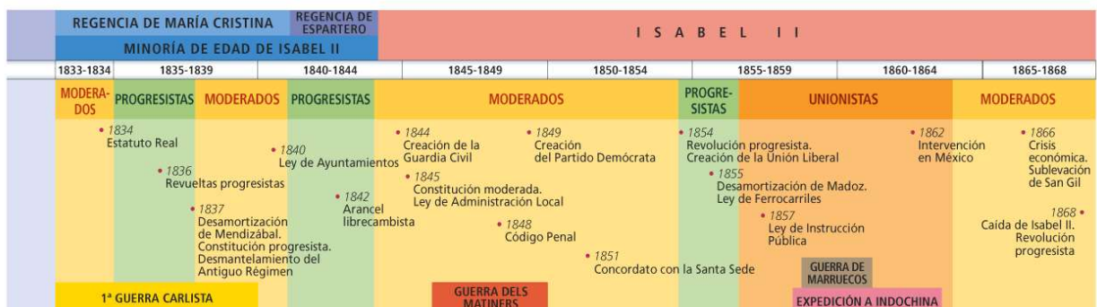
Eje cronológico con el reinado de Isabel II (1833-1868).