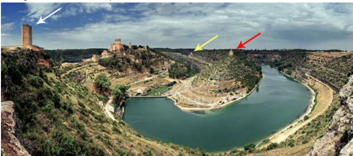
Torres exteriores (de izquierda a derecha): torre del Campo, torre del Cañavate y torre de Alarconcillos.

Tras este recorrido solo nos queda ya por visitar la torre del Campo pero está ya a la salida de Alarcón en dirección a la carretera general y desde la cual tenemos una amplia panorámica con vistas de la villa y de su emplazamiento. Esta torre es una defensa adelantada que tiene su propio recinto con plaza de armas y lienzo de muralla que guardaba la entrada a la ciudad. Es de planta pentagonal con entrada por una puerta colocada a considerable altura y con alguna ventana formada por sillares labrados.