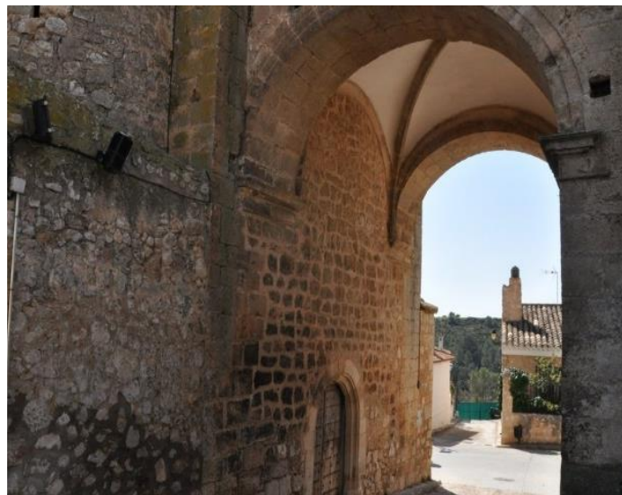
Pasaje debajo de la torre. Santísima Trinidad.

Todo ello flanqueado por dos columnas cilíndricas, con basas de anillos y profusamente decoradas con motivos renacentistas. A los pies de la nave antigua hay una torre montada sobre la calle e incorporada a la antigua escalera del coro, de tres cuerpos y coronada por una balaustrada. La planta baja de esta torre tiene un hueco de