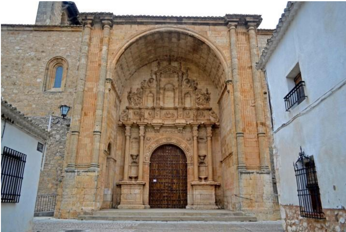
Portada meridional plateresca de la iglesia parroquial de Santa María.

comunicación de calla bajo un arco de medio punto rematado por un frontón triangular partido. Este pasaje es el llamado Arco de la Villa.