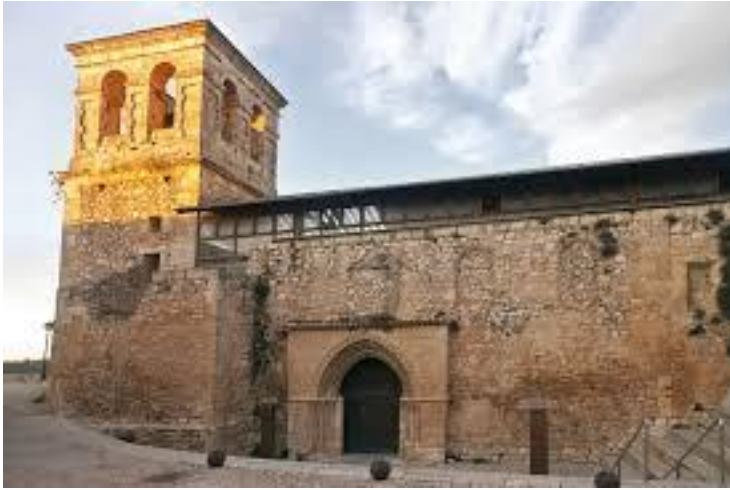
Iglesia de Santo Domingo de Silos.

de planta rectangular y ábside semicircular quedando de su primitiva bóveda solo los arcos fajones y formeros. En el lado Norte está la entrada a una capilla lateral con bóveda de crucería que se cierra curiosamente en un triángulo. Frente a esta capilla se encuentra la sacristía que es de planta cuadrada y tuvo primitivamente una cúpula.