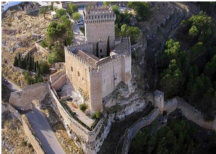
Vista aérea del castillo y las murallas de Alarcón.

Se atribuye la fundación de este castillo al