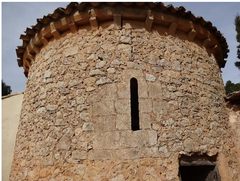
Ábside románico de la iglesia de Santiago en el cementerio.

A mediodía del tapial del cementerio podemos admirar la profunda garganta que forma la Hoz del río Júcar e incluso a través de la puerta