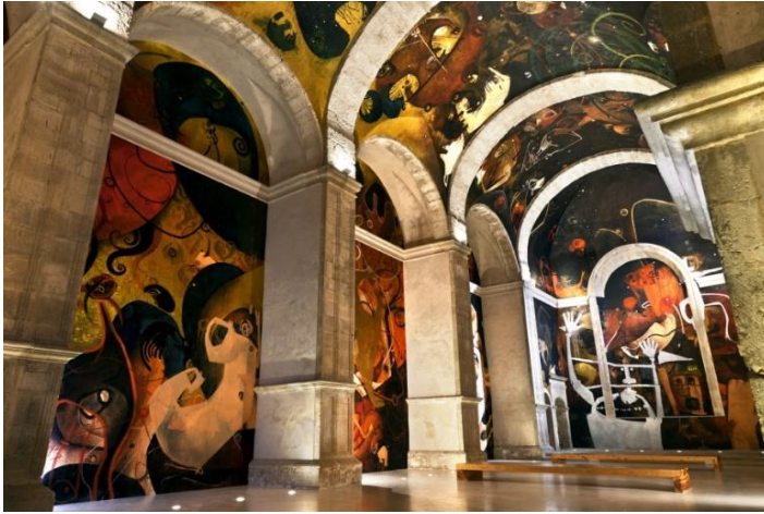
Interior de San Juan Bautista con pinturas contemporáneas.

arquitectura civil del siglo XVI queda rematado en las esquinas superiores por pequeños pináculos.