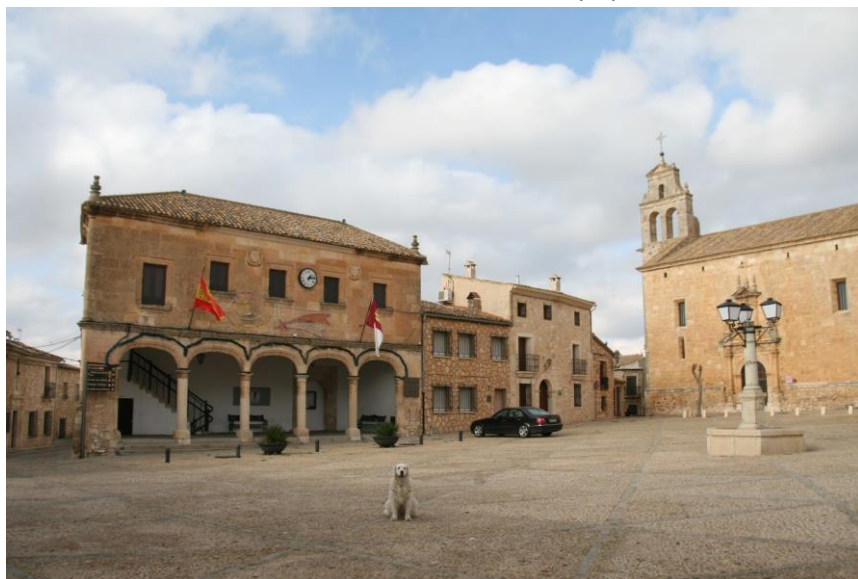
La Plaza Mayor: ayuntamiento e iglesia de San Juan Bautista.