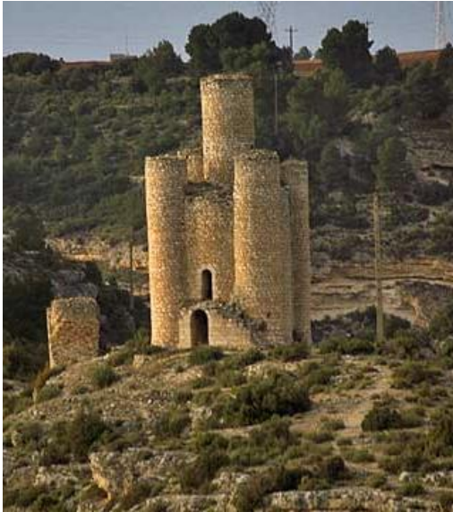
Torre de Alarconcillos.

rey Alfonso VIII, siendo restaurado posteriormente por el infante D. Juan Manuel y más tarde por el marqués de Villena.