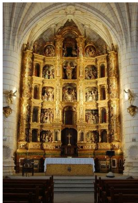
Retablo de Santa María.

De planta ligeramente rectangular y bien proporcionada y armoniosa, cuenta con una espadaña-campanario de dos huecos y ábside poligonal de cinco lados. A poniente, bellas ventanas con baquetones al estilo isabelino y el resto sin baquetones, abocinadas y arqueadas. Tiene tres portadas: una al poniente, que es la más primitiva con arquivoltas simples sobre la que hay una ventana con la misma línea, de estilo manierista, abocinada con arco rebajado con frontón de hornacina rematado por otro triangular y una cruz trilobulada entre los dos floreros. Pero la más suntuosa y monumental es la portada principal orientada al mediodía, verdadero retablo renacentista tallado en piedra bajo un arco de triunfo saliente de bóveda de