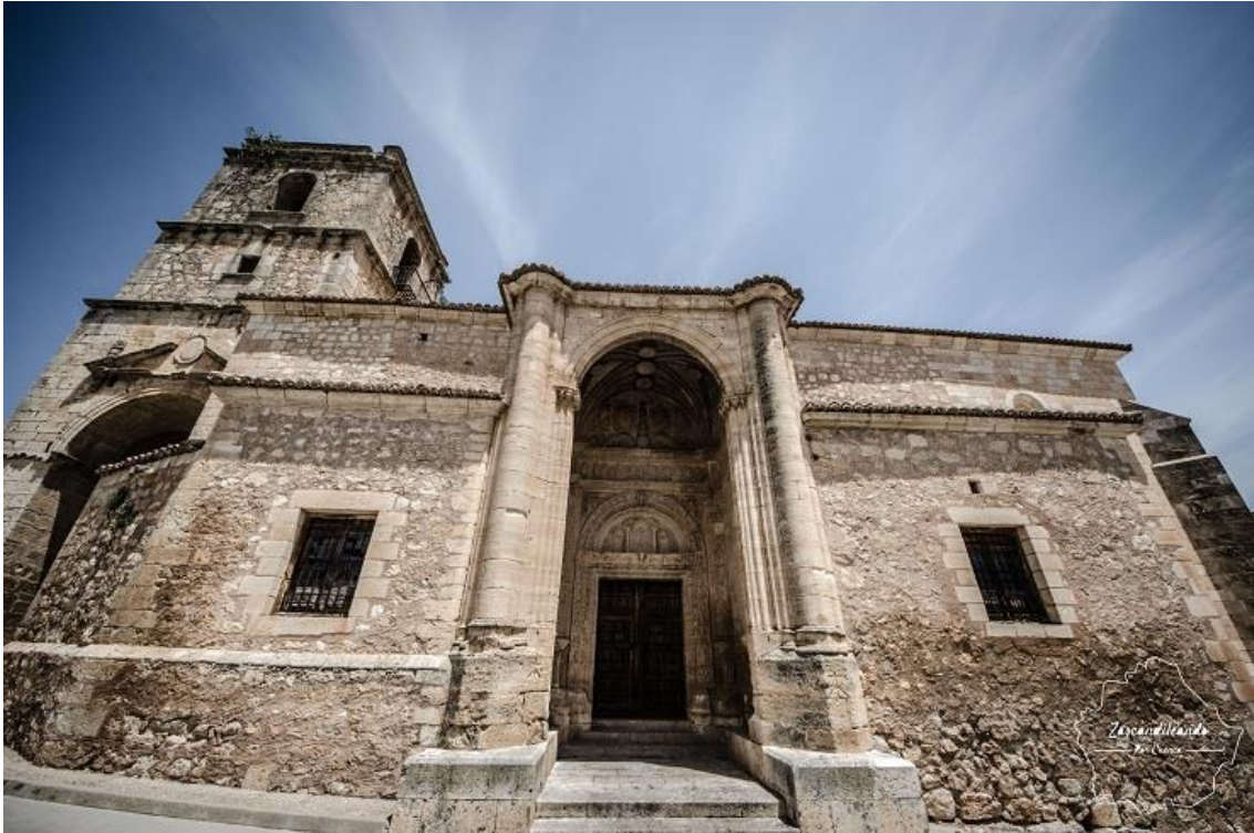
Portada meridional de la Santísima Trinidad, al oeste la torre-pasaje.

del Picazo o de las Moreras del recinto amurallado podemos descender hasta el puente del mismo nombre.