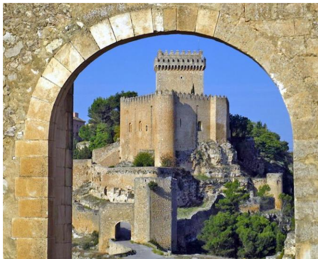
Vista del acceso a la villa y el castillo.

El notable emplazamiento natural sobre el que se levanta la villa se encuentra rodeado casi en su totalidad por el río Júcar que discurre encajado entre dos muros rocosos casi verticales, uniéndose la meseta sobre la que se levanta la población al resto del terreno municipal por una lengua de tierra que es un largo estrecho camino o istmo que hace de Alarcón una península.