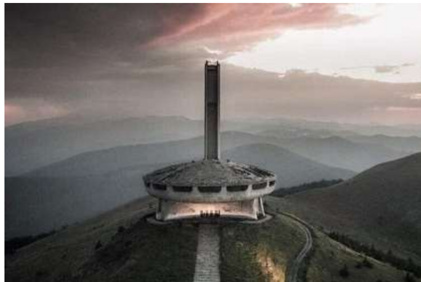
Vista aérea del monumento del monte Buzludzha.

Desde el punto de vista arquitectónico, el emplazamiento condiciona decisivamente el proyecto. La cima del monte, a más de 1400 metros de altitud, presenta condiciones climáticas extremas, con fuertes vientos, nieve abundante y grandes variaciones térmicas. El edificio se concibe así como una estructura maciza, casi fortificada, capaz de resistir las condiciones ambientales. Al mismo tiempo, su