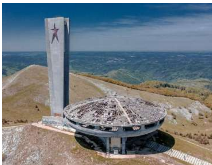
Vista aérea donde se aprecia el estado de abandono.

Desde el punto de vista estilístico, el monumento se sitúa en la intersección entre el brutalismo y la