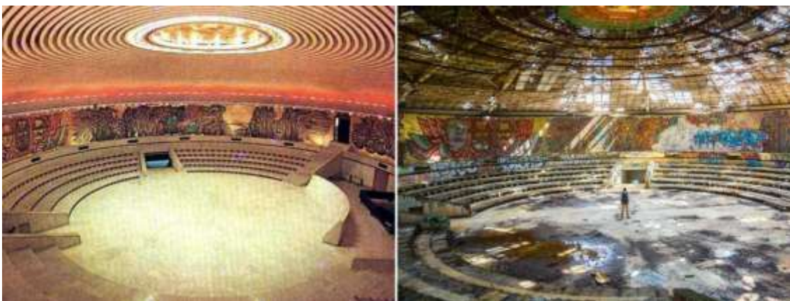
Vista interior de la gran sala, antes y ahora.

El volumen principal tiene aproximadamente 60 metros de diámetro y se apoya sobre un basamento macizo que se adapta a la topografía del terreno. La cubierta, ligeramente inclinada, genera una silueta aerodinámica que enfatiza el carácter escultórico del edificio. La