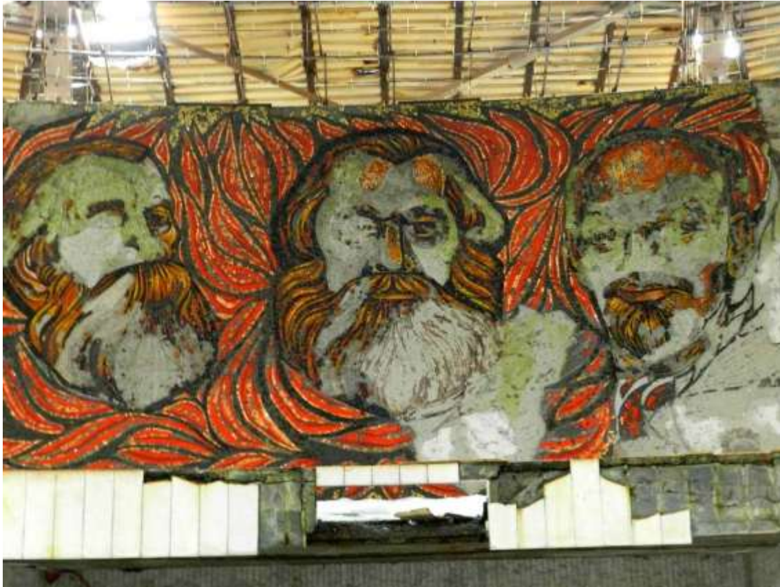
Restos de mosaicos con las caras de Engels, Marx y Lenin.

arquitectura monumental socialista. El uso del hormigón armado, las formas geométricas rotundas y la escala monumental remiten a las tendencias brutalistas de las décadas de 1960 y 1970. Sin embargo, el edificio también se aleja del brutalismo occidental al incorporar una fuerte dimensión simbólica y narrativa.