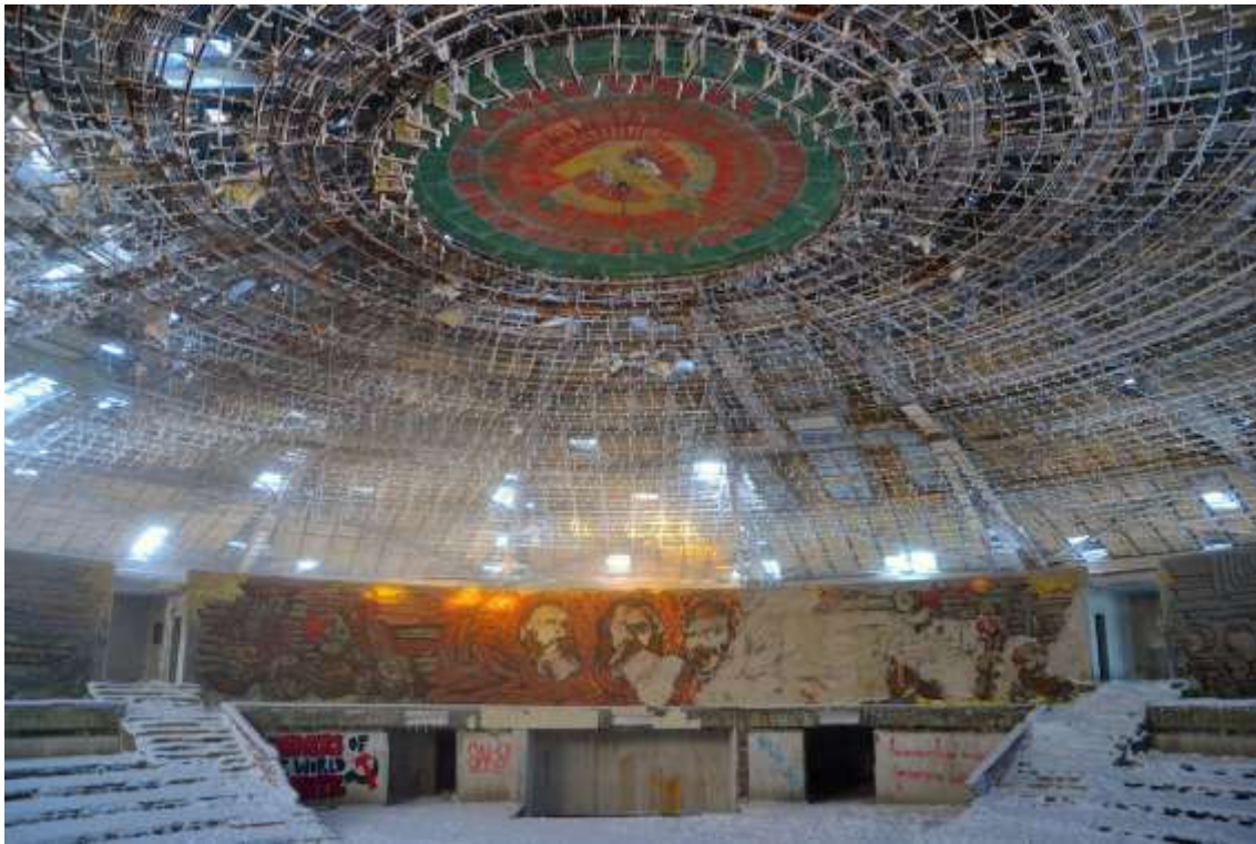
Vista interior de la gran sala, hoy totalmente deteriorada.

aislamiento en la montaña refuerza su carácter simbólico: la arquitectura aparece como una presencia dominante en el paisaje, visible desde grandes distancias y concebida para imponerse visualmente sobre el territorio circundante.