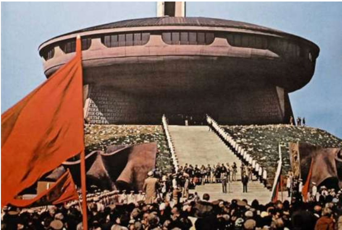
El monumento en su momento de mayor esplendor como telón de fondo de las grandes concentraciones del Partido Comunista Búlgaro.

En definitiva, el Monumento de Buzludzha representa una de las expresiones más extremas de la arquitectura monumental socialista. Más que un simple edificio, es una construcción simbólica que encarna las aspiraciones, los mitos y las contradicciones de una época histórica. Hoy, transformado en ruina, continúa fascinando tanto a arquitectos como a historiadores, recordándonos el poder de la arquitectura para materializar las ideologías y, al mismo tiempo, la inevitabilidad de su transformación a lo largo del tiempo.