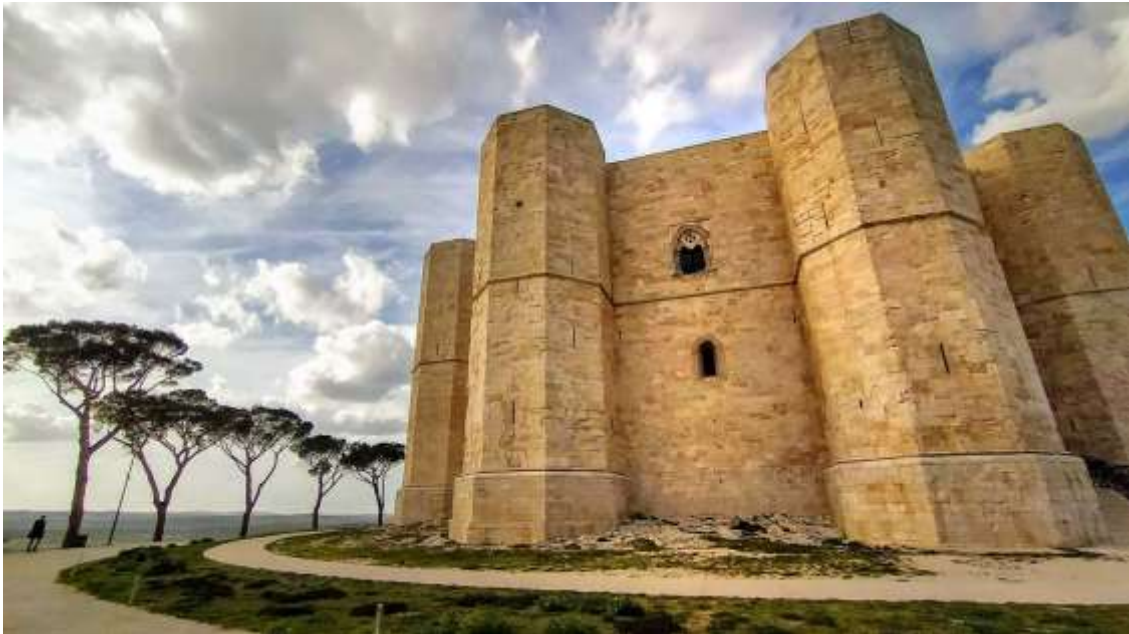
Castel del Monte, Italia.

Desde el aparcamiento hasta el castillo hay que caminar unos 1000 m por una carretera asfaltada o asfaltada.