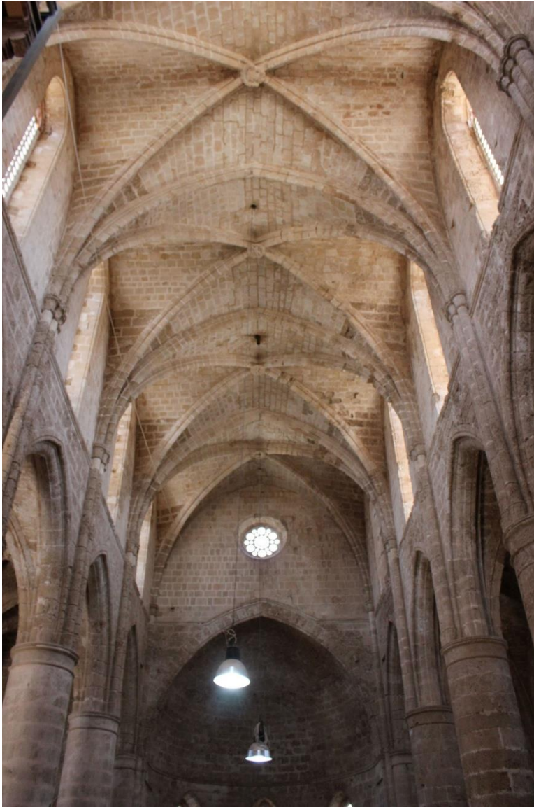
Bóvedas de la iglesia de San Pedro y San Pablo.

veintiún años para desaparecer. Es de destacar el citado pórtico renacentista de grandes dimensiones elaborado también con columnas traídas de las ruinas de Salamina.