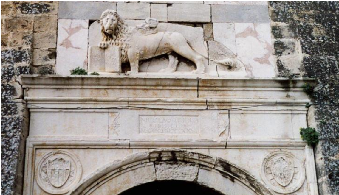
León de San Marcos encima de la Puerta del Mar de las murallas venecianas de Famagusta.

Con todo, las fortificaciones no fueron suficiente para evitar la toma de la ciudad por los turcos otomanos el 8 de agosto de 1571, la revancha se la darían los venecianos junto con los españoles en la batalla de Lepanto dos meses después aunque de consecuencias limitadas.