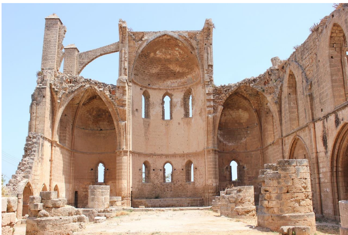
Restos de la iglesia de Sa Jorge de los Griegos.

La portada de los pies es muy sencilla, tres simples puertas con arcos apuntados. En el exterior destacan sus tres poderosos ábsides, el del centro de mayores dimensiones.