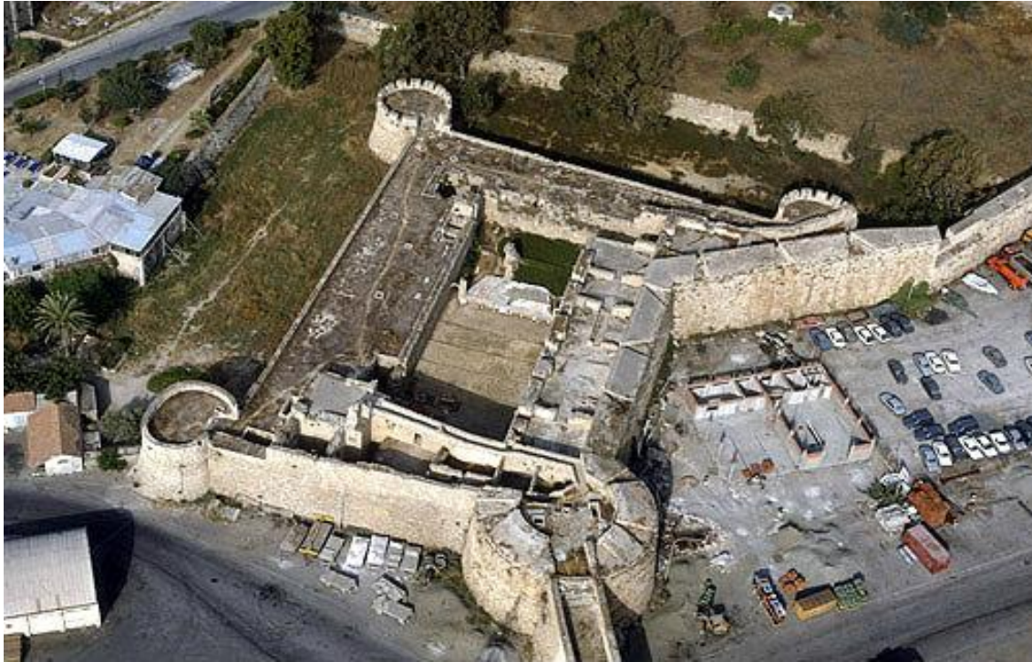
Vista aérea de la torre de Othello en la muralla veneciana.

es deficiente y no queda nada de la decoración. Muy próxima a ella está la iglesia de Santa María del Carmelo , un esqueleto gótico del siglo XIV con una sola nave y en el que han desaparecido las bóvedas. Muy cerca, y próxima también a San Jorge el Exiliado, se encuentra Santa Ana de los Latinos también de mediados del siglo XIV, no tiene torres pero sí dispone de espadaña, tal vez fue en orígenes un convento benedictino.