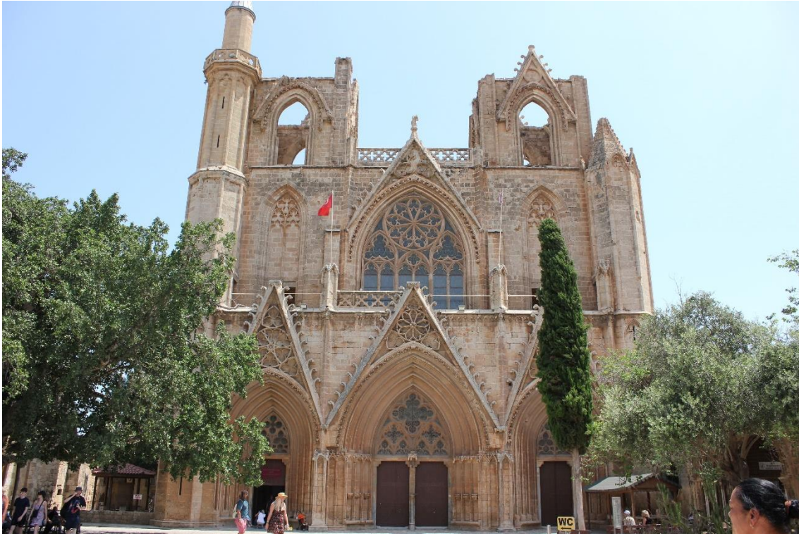
Fachada de la catedral de San Nicolás, hoy mezquita de Lala Mustafá.

por los otomanos tras un largo asedio en 1571, transformando en mezquitas un gran número de iglesias. Junto a la transformación en mezquitas también se produce la construcción de otros edificios típicamente turcos: baños, caravansares, bazares, casas de una planta, calles sin salida... Pero la ciudad no recuperó su antiguo esplendor.