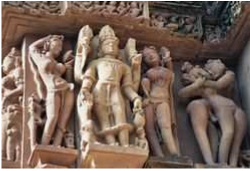
Detalle de uno de los grupos escultóricos.

como para romper la monotonía de las figuras humanas. Las imágenes de dioses y diosas forman el cuarto grupo y suelen estar situadas al fondo del templo o en los nichos situados bajo los salientes. Finalmente se encuentran las figuras femeninas y las que representan a parejas amatorias.