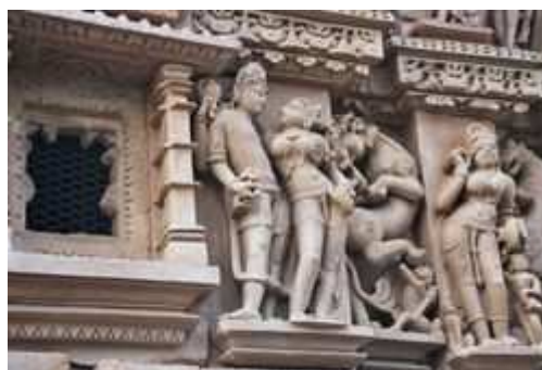
Vishnu junto a una compañera. A su lado, una mujer maquillándose.

• Templo Chitragupta: en su interior se encuentra una estatua de Surya, el dios del sol, montado en su carro tirado por siete caballos.