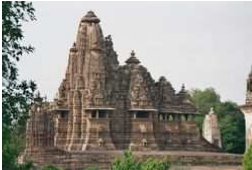
Uno de los templos de Khajuraho.

Khajuraho es una pequeña localidad situada en el estado de Madhya Pradesh en la India. Su población según datos del censo del 2001 era de 7.665 habitantes.