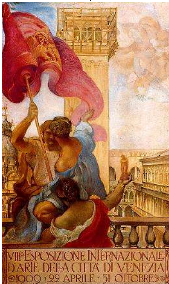
Cartel de 1909 con la torre casi terminada.

Es prodigioso que allí donde podía haberse producido una espantosa hecatombe, donde la sangre podría haber corrido a torrentes, no haya que lamentar ni una sola víctima, ni una sola gota de sangre».