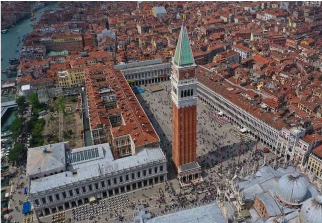
Vista aérea de la plaza con la torre como protagonista.

En el año 976 se produjo el primer gran incendio, desencadenado durante la revuelta contra el dux Pietro Candiano IV. El fuego destruyó parcialmente la basílica y el Palacio Ducal,