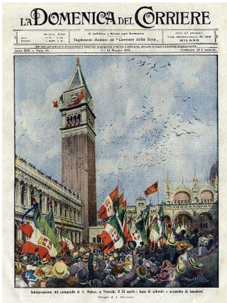
Inauguración de la torre en un periódico de la época, 25 de abril de 1912.

Un profundo horror oprime cada corazón; la multitud llora al gigante caído como a un querido difunto.