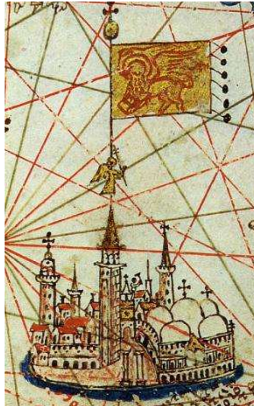
Venecia y la torre en un mapa del siglo XVI.

Las murallas fueron reforzadas y se añadieron la celda de las campanas, el ático y el