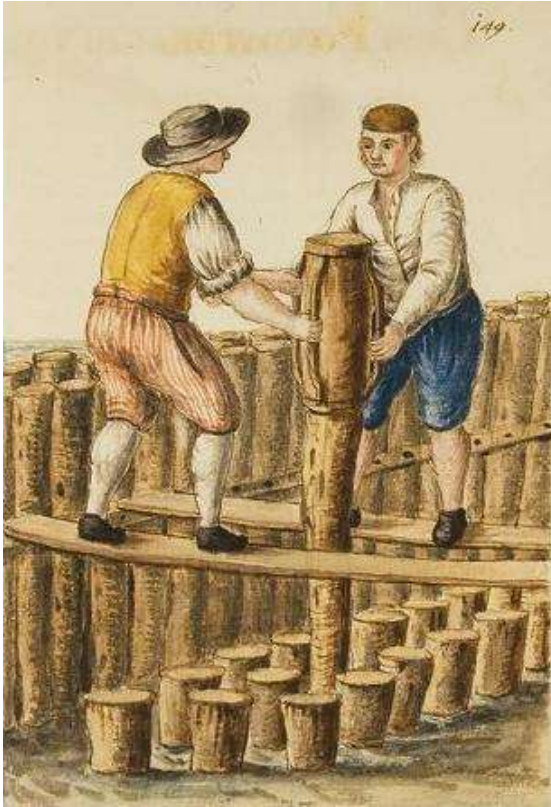
Los battipalo o construcción sobre pilotes, es la forma de cimentación usada en Venecia.

pináculo. La cúspide dorada fue coronada por la figura del arcángel Gabriel en cobre dorado, lo que permitió que el parone di casa —apelativo con el que el pueblo veneciano designaba afectuosamente al campanario— alcanzara más de noventa y ocho metros de altura.