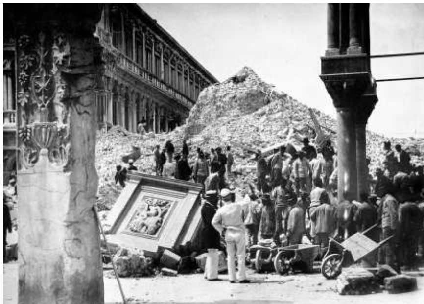
Fotos de la torre recién derrumbada el mismo día 14 de julio.

Los testimonios de los presentes describen