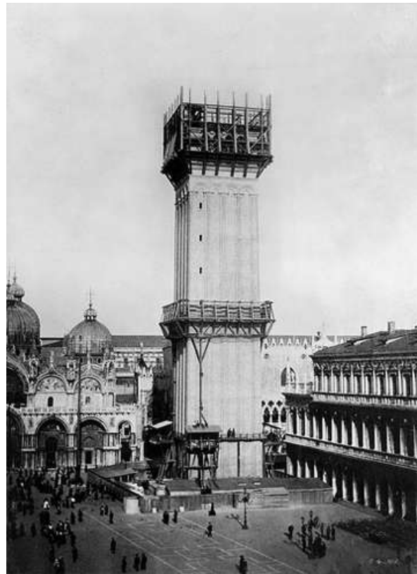
La torre durante la reconstrucción.

«...sin causar daño en su caída, deteniendo la monstruosa ola de su derrumbe ante el umbral de la iglesia y limitando el desplome de sus miembros junto a la puerta divina, en un prodigioso gesto de reverente contención y de suprema aspiración. El ángel de oro yacía ante la gran puerta de la basílica con las alas rotas en el anhelo de aquel último vuelo.